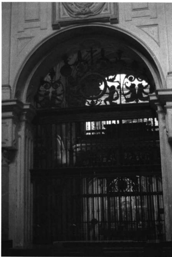
Ilustración 2.- Catedral de Córdoba. Reja de la capilla de la Conversión de San Pablo. Juan Martínez.