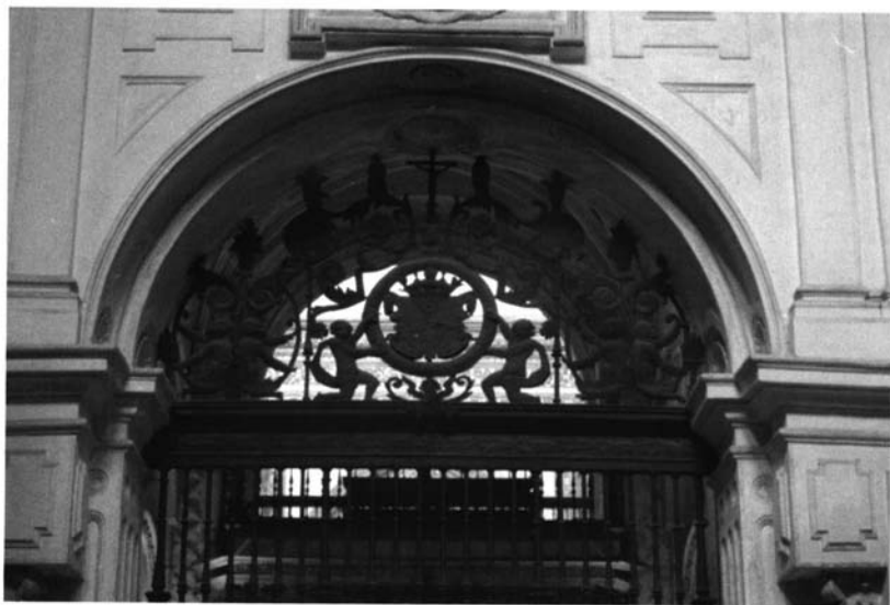
Ilustración 3.- Catedral de Córdoba. Reja de la capilla de la Conversión de San Pablo. Juan Martínez. Detalle de la crestería.