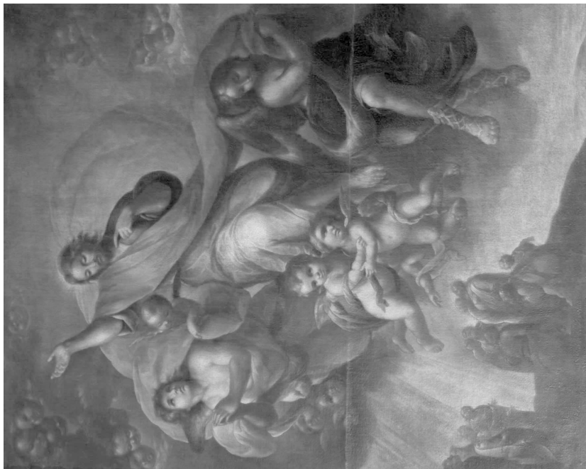
Fig. 2. Domingo Martínez. Ascension de Cristo . Parroquia de Nuestra Señora de Belén. Ġines (Sevilla).