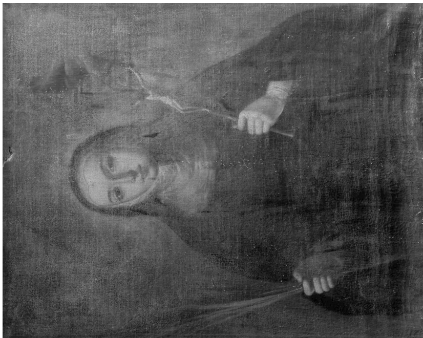
Fig. 1. Domingo Martínez. Santa Rita . Parroquia de Nuestra Señora de Belén. Ġines (Sevilla).