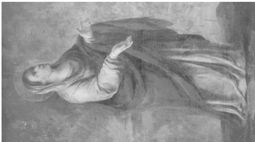
Fig. 5. Juan de Espinal. Virgen Dolorosa . Hermandad Sacramental de la Soledad. Parroquia de San Lorenzo (Sevilla).