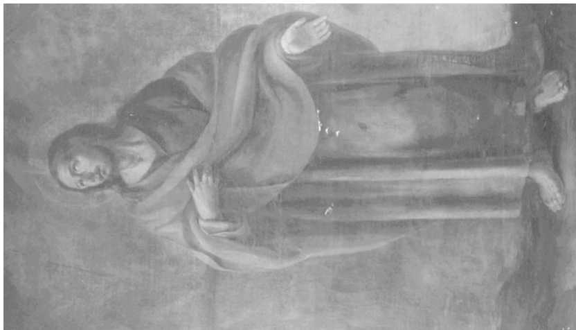
Fig. 6. Juan de Espinal. San Juan Evangelista . Hermandad Sacramental de la Soledad. Parroquia de San Lorenzo (Sevilla).