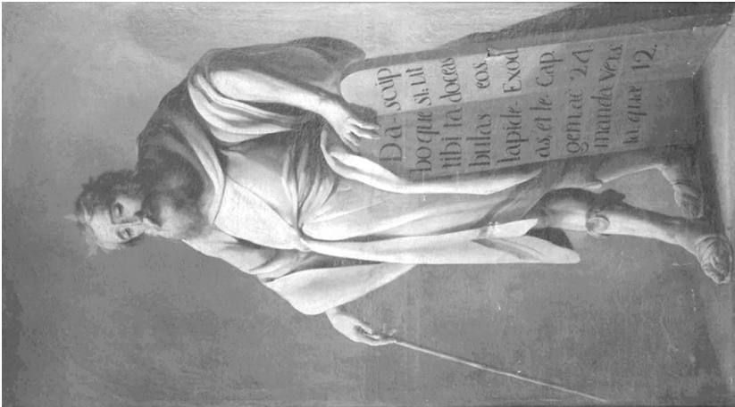
Fig. 3. Juan de Espinal. Moisés . Hermandad Sacramental de la Soledad. Parroquia de San Lorenzo (Sevilla).