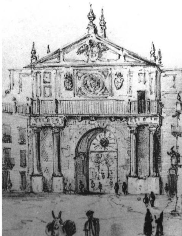
Interior de la Puerta de Triana, 1832. Richard Ford, Londres, Colección Brinsley Ford.