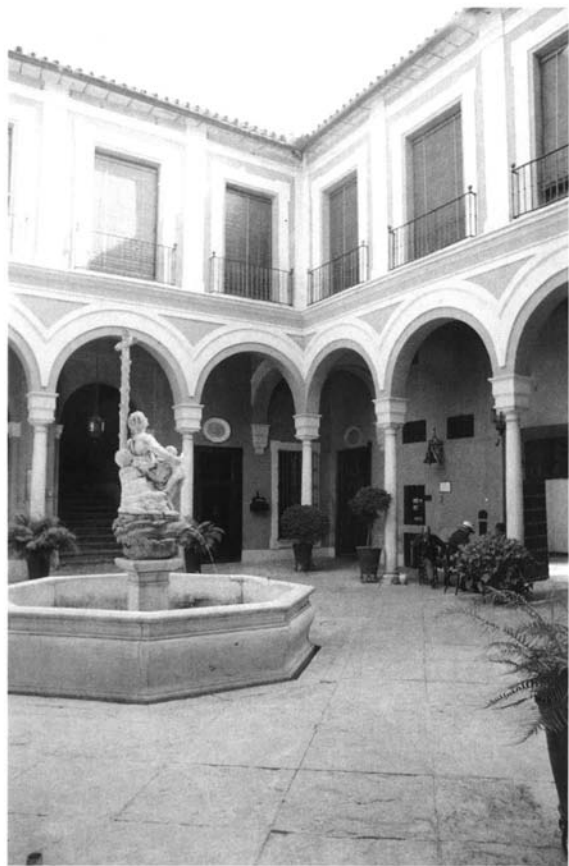
Fig. 4. Patio del Hospital de la Caridad