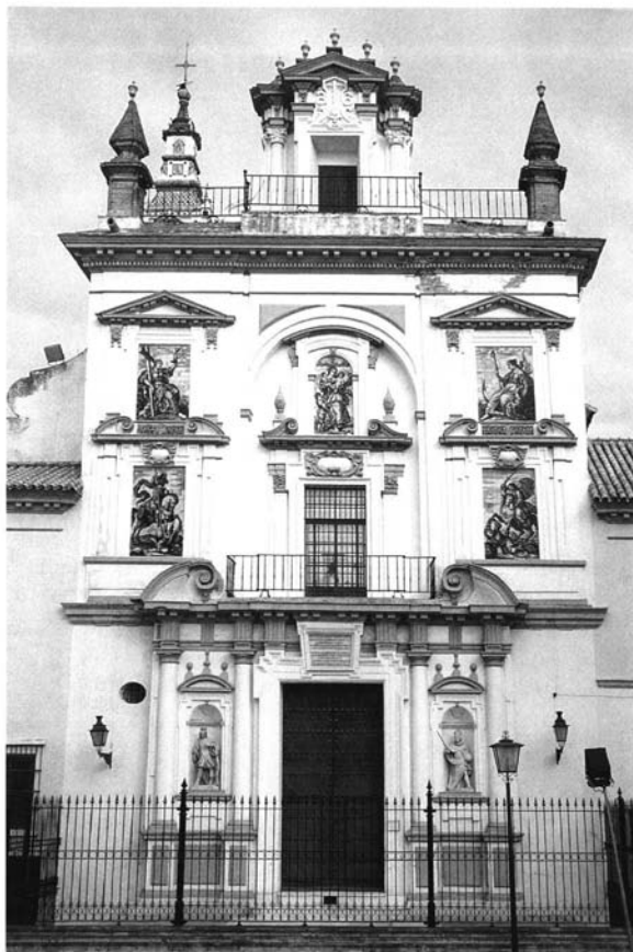
Fig. 3. Iglesia del Hospital de la Caridad. Fachada