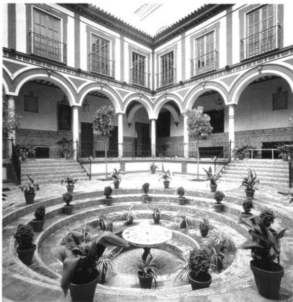
Fig. 1. Hospital de los Venerables. Patio principal