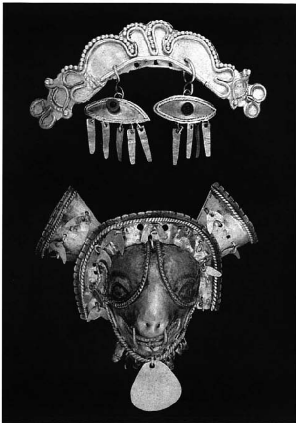
Figura 2 bis.