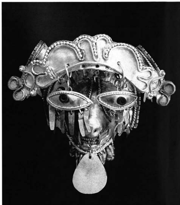
Figura 2 y 2 bis. - Mascarilla zoomorfa con diadema desmontable con ojos colgantes. Oro, plata, platino y pedrería. La Tolita. Museo Nacional del Banco Central del Ecuador.