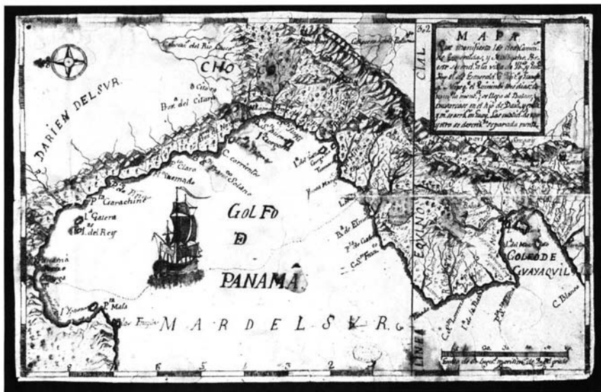
Mapa 2.- Mapa del camino de Esmeraldas. A.G.I. M y P. Panamá, Santa Fe y Quito, 230.