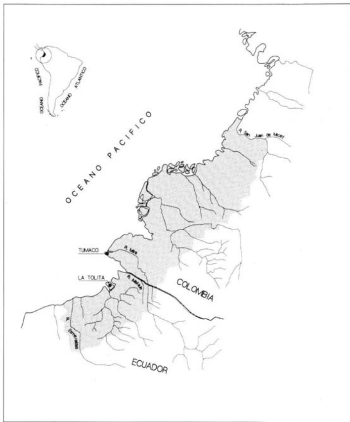
Mapa 3.- Área cultural La Tolita-Tumaco, según Francisco Valdez.