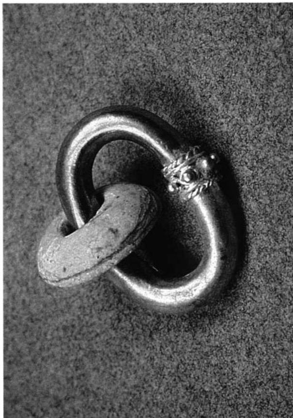
Figura 3.- Orejera. oro y platino. Tumaco. Museo del Oro, Santa Fe de Bogotá, Colombia.