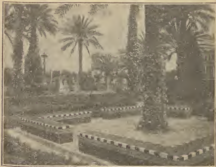
Exposición Ibero Americana / Un aspecto de la Plaza de América

The visitor to Seville ought to visit the following, at least