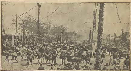
Un aspecto de la Feria