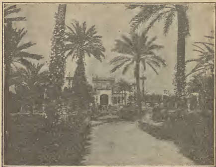
Exposición Ibero Americana / Pabellón Real