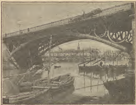
Un arco del Puente de Triana

ARACENA.—Importante ciudad de la Sierra, metrópoli del distrito de su nombre. En la parroquia de la Asunción existe un retablo de Martínez Montañés y unas curiosas puertas mudéjares. Ruinas del castillo árabe, uno de cuyos propugnáculos se conserva como torre de campanas de la interesante iglesia ojival, fundada por los Templarios; preciosa joya arquitectónica. En este templo puede admirarse una mag-