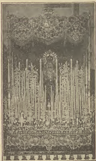
Nuestra Señora de la Esperanza / Macarena