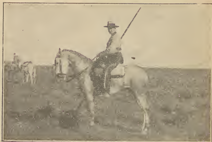
Del campo andaluz / Un garrochista