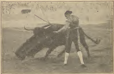
Corrida de toros / Un pase natural

trouve Moguer , cité que vit naître les Pinzones et d'autres marins d'importance, on y admire d'intéressants batiments ainsi que le Port de Palos d'où partirent les célèbres caravelles qui découvriren un monde.