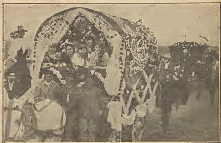
Carreta de Romería

te. The celebrated and mervellous Great Mosque of the West , is one of the Wonders of the World. The work was begin in the year 786 of the Christian Era and materials from all Roman and Visigoth buldings in all Andalusia were used in its construction. It was consecrated as a Catholic temple by St. Ferdinand, after the reconquest and inside innumerable treasures of Christian Art are accumulated.— Provincial Painting Museum. — Román Bridge over the Guadalquivir and other very important buildings.—The journey