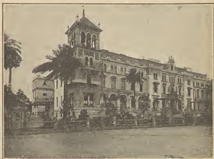
Exposición Ibero Americana / Gran Hotel Alfonso XIII