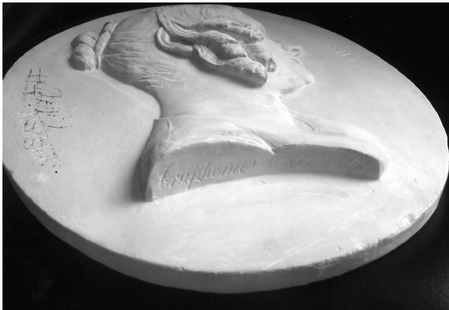
Figura 4. Firma "Trupheme Aix 1848".