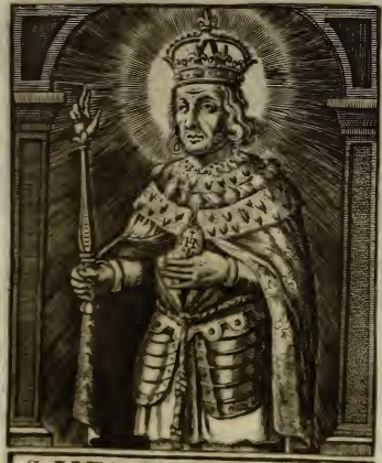
S. LVIS. REY. DE. FRANCIA