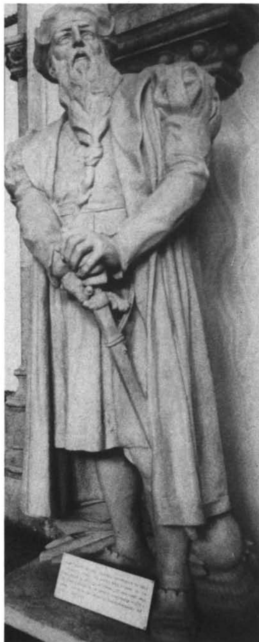
Fig. 3. Escultura de Alfonso de Albuquerque, obra de Maximiano Alves (Museo de la Marina de Lisboa).