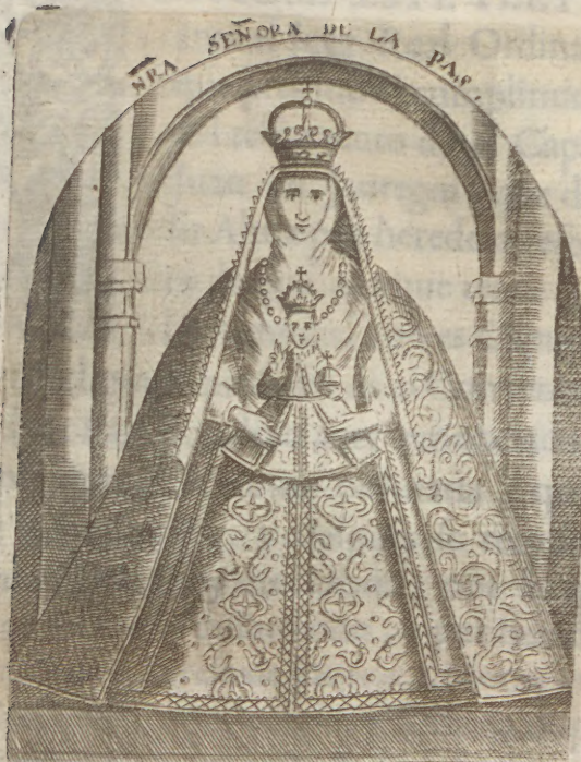
Si non desce Virgin, sagrada. De suavia per tua bellitas Gode vnaq' la... de in... de ella se cubre