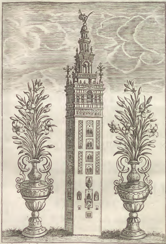
S o Roman Felina o d o n o y sculp