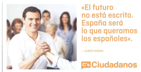
Imagen 1. Campaña electoral de Ciudadanos, Elecciones Generales Españolas 2016. Copyright: Ciudadanos. Licence: CC BY-NC-ND

Rivera se presenta como jefe de partido. Los folletos de su campaña lo erigen en líder carismático, al que se le atribuyen incluso frases de carácter sentencioso: