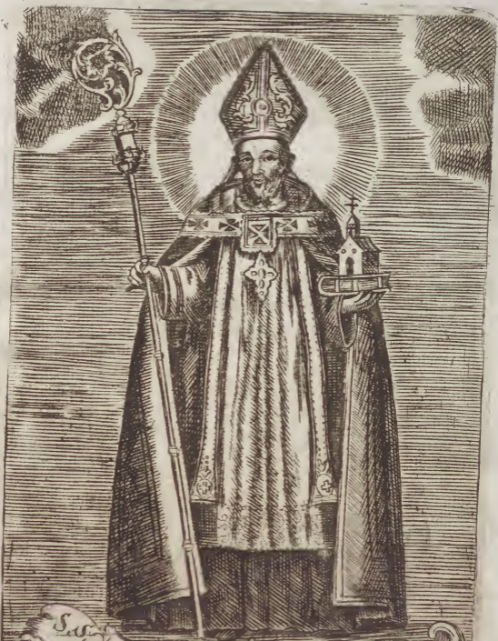
S. Isidoro Arzobispo de Sevilla. y Doctor de las Espanas.