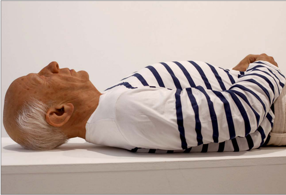
Figura 8. Eugenio Merino, Aquí murió Picasso. Instalación. Alianza francesa. 2017.

ción deseada. La figura hiperrealista que expone Merino supone una recreación de la figura yacente del genio malagueño... Aquí murió Picasso es una reflexión, desde la ironía, sobre los efectos del turismo en la ciudad de Málaga. Una atracción más que da respuesta a lo que el turista desea ver, analogía de la ciudad de Málaga que se transforma en función de lo que necesitan 8