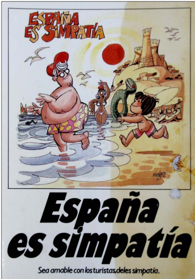
Figura 2. Postal, España es simpatía. Editada por Turespaña, Secretaría General de Turismo. 1987.

No resulta menos contradictorio que en un momento en el que se entendió, ahora sí al turista como tal, fuente de avance para una sociedad atrasada a la del resto de Europa, estos buscaran el eco de una España y una Andalucía del pasado: “...esos turistas, en los que nos empeñamos en ver una vía de modernización de la sociedad tardofranquista, vinieran buscando precisamente la España más atrasada” (Fuentes Vega, 10). A los clichés románticos, al pasado monumental y a las nuevas estampas de ‘sol y playa’ que se ofertaban, se sumó el ingrediente del idilio rural, la búsqueda rousseauiana del paraíso primitivo perdido. En La hora dorada: el turismo internacional y la periferia del placer de Turner y Ash (1991) se hace referencia a la idealización de lo pastoril fruto de la cada vez más imperante sociedad industrial.