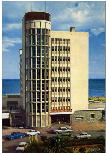
Figura 3. Postal. Hotel Pez Espada, Torremolinos, Málaga. 1960 4 . Colección particular.