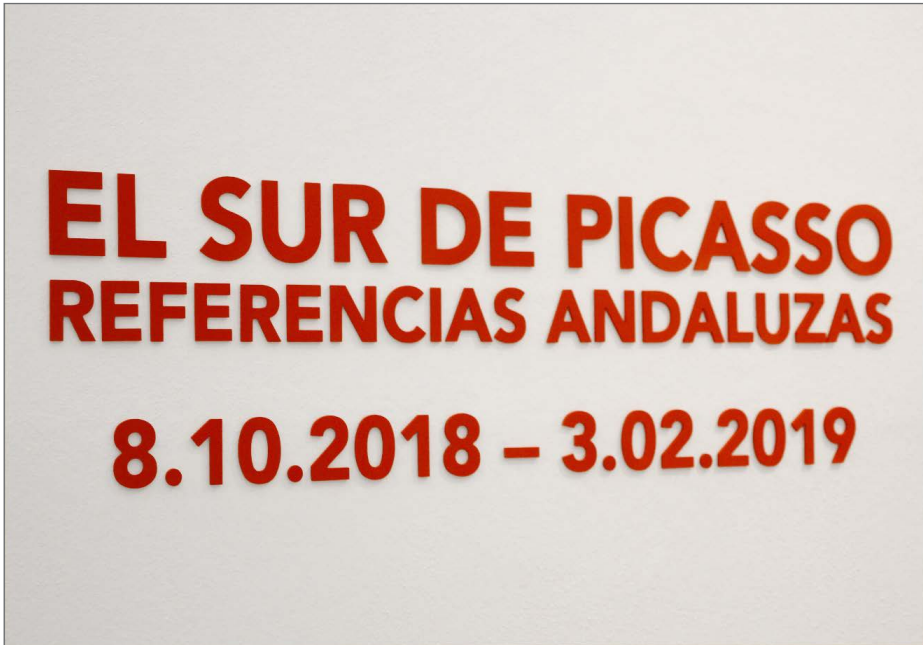
Figura 7. El sur de Picasso. Referencias andaluzas. Exposición, Museo Picasso Málaga. 2018 7 .

Una ficción programada desde el ámbito institucional con el fin de resignificar a Málaga como cuna del artista, forzando los discursos y creando analogías débiles (Fig. 7). En su proyecto Surviving Picasso / Sobrevivir a Picasso –que ahora se torna premonitorio–, López Cuenca lanza una pregunta a partir de un ejercicio de psicoanálisis colectivo de la sociedad malagueña: “¿hay posibilidad de vida -inteligente, hay que puntualizar- después de Picasso?, ¿qué arte y qué cultura podemos proponer en este contexto?” (Cervantes Garrido 2011). El testigo de su reflexión ha sido recogido desde el propio ámbito artístico a través de propuestas como la del artista Eugenio Merino: