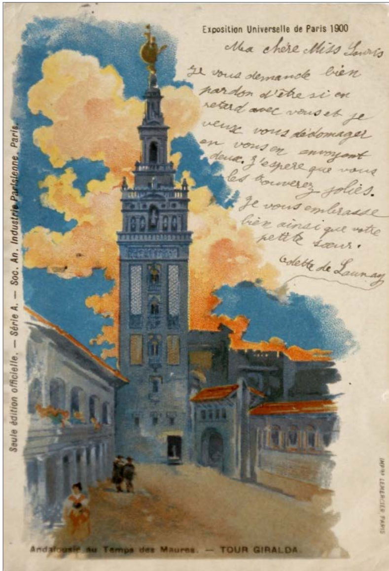
Figura 1. Postal, Andalousieautemps des Maures – Tour Giralda. 1900 1 .

ocio” (Lipovetsky & Serroy 2013, 38). Veremos más adelante como la adecuación a las exigencias turísticas van más allá de la preservación y adaptación de los espacios, también implican un cambio o amoldamiento del carácter del anfitrión’.