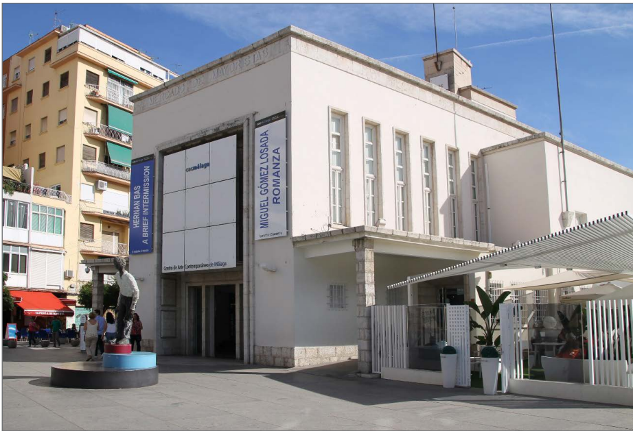
Figura 4. Centro de Arte Contemporáneo, Málaga. 2018.

En paralelo a la conversión de la ciudad en un parque temático de la cultura nos encontramos con la mitificación de la figura de Picasso. La ‘picassización’ de Málaga nace al amparo de los primeros cambios para convertirla en una ciudad museo. El artista Rogelio López Cuenca en su proyecto Ciudad Picasso (Figs. 5 y 6) aborda el tema en cuestión y el origen del fenómeno: