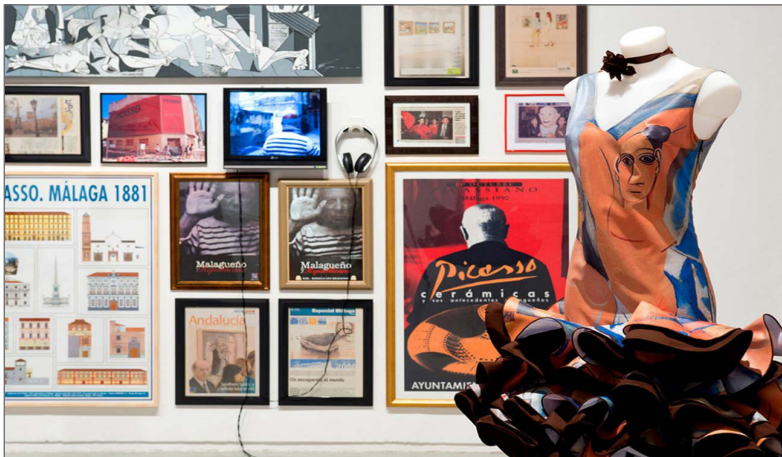
Figuras 5 y 6. Rogelio López Cuenca, Casi de todo Picasso . Instalación multimedia, dimensiones variables. Galería Juana de Aizpuru, Madrid. 2010.