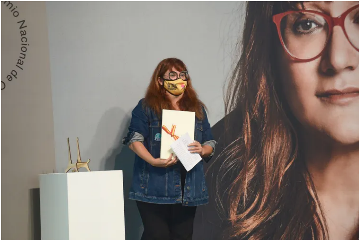
Isabel Coixet durante la ceremonia de entrega del Premio Nacional de Cine, en San Sebastián el 19 de septiembre de 2020.