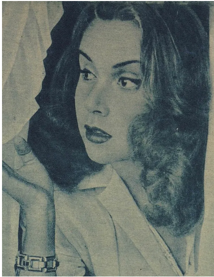
La actriz y directora Ana Mariscal en 1945.

Ana Mariscal tuvo una presencia importante entre los años cincuenta y sesenta; aunque se la reconoció como actriz, dirigió diez largometrajes. Su primera película fue Segundo López, aventurero urbano (1953) y la última registrada fue El paseílo (1968).