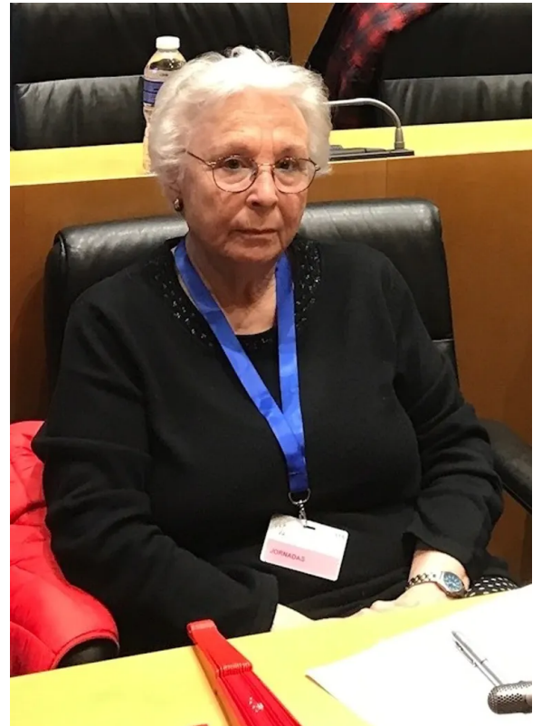
Josefina Molina en 2018.

Sin embargo, muchas han tenido la pertinaz audacia para exhibir más de diez proyectos incluyendo, también, géneros como la animación. Con sus contribuciones, todas han fortalecido la idea de que no