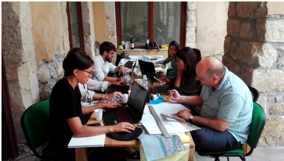
Fig. 5 Profesores, tutores y alumnos trabajando de forma conjunta durante el Workshop Architecture, Archaeology and Tourism (Palazzolo Acreide, Sicilia, Italia).

En definitiva, los talleres suponen la respuesta docente de una línea de investigación específica en torno a las interconexiones entre paisaje, patrimonio, turismo y arquitectura, siendo la modalidad intensiva, la experiencia in situ, el aprendizaje servicio y la internacionalidad sus cuatro pilares principales.