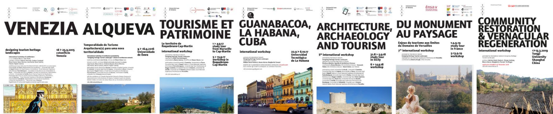
Fig. 4 Carteles de las diferentes ediciones. Fuente: Elaboración propia, recopilados de http://www.iuav.it/Didattica/1/workshop-e/2016/HERITAGE-T/ (2020)

Por otro lado, los talleres también se posicionan respecto a la interpretación del turismo en paisajes patrimoniales. En ellos se enfatiza que el proyecto de paisaje no es sinónimo de proyecto de dinamización turística y, para ello, buscan desplazar el énfasis desde la perspectiva económica hacia el desarrollo sostenible. El proyecto de paisaje permitiría aumentar la competitividad de un territorio a través de su identidad propia. Tratando de huir de un “estado fosilizado” del patrimonio, el proyecto de paisaje mira hacia el turismo cultural pero también hacia el uso y disfrute del paisaje por parte de la población local, cuyo compromiso e implicación con el espacio que habita se revela fundamental para una gestión efectiva del paisaje “de abajo hacia arriba” y para la preservación de las economías y los sistemas locales. La actividad turística es un valor territorial añadido que debe convivir con un ambiente humanizado y vivo.