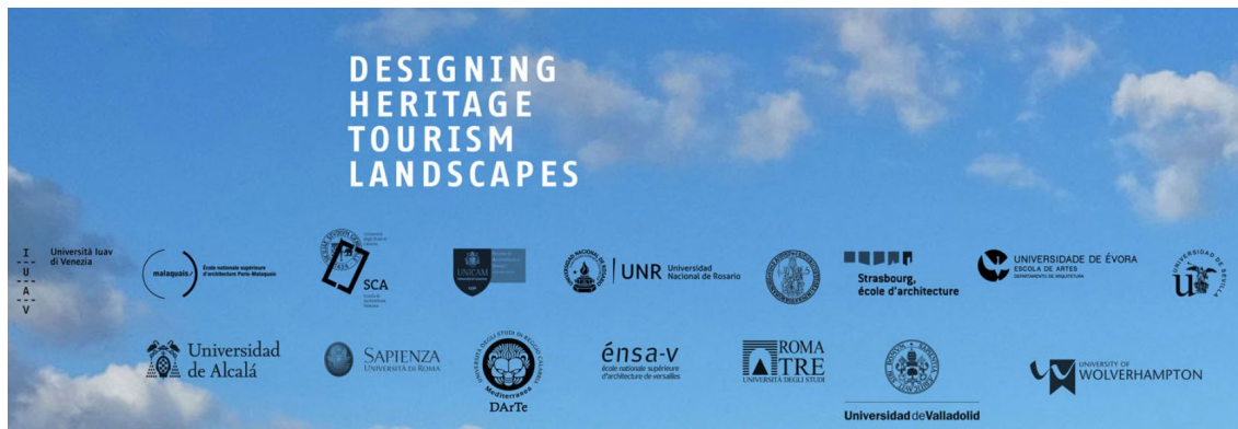
Fig. 2 Escuelas de arquitecturas participantes en la red DHTL.