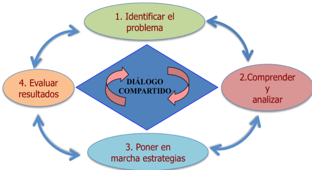
Figura 2: Ciclo colaborativo de resolución de problemas

En la práctica, los grupos de apoyo han reinterpretado y adaptado este modelo colaborativo de resolución de problema, como señala una madre miembro del GAM: “Recogemos la información, ponemos en marcha el caso, se lo damos a la persona, le ayudamos a hacer el plan y una vez finalizado el caso se empieza con otro” (Madre GAM 1, Escuela Infantil de Cádiz).