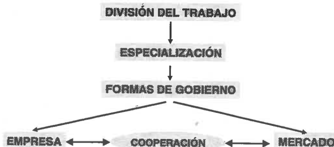
Fig. 1: Diferentes alternativas organizativas para el gobierno de una transacción.