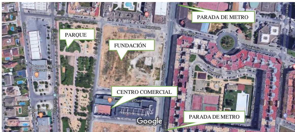
(IMAGEN 1. OBTENIDA DE GOOGLE MAPS)