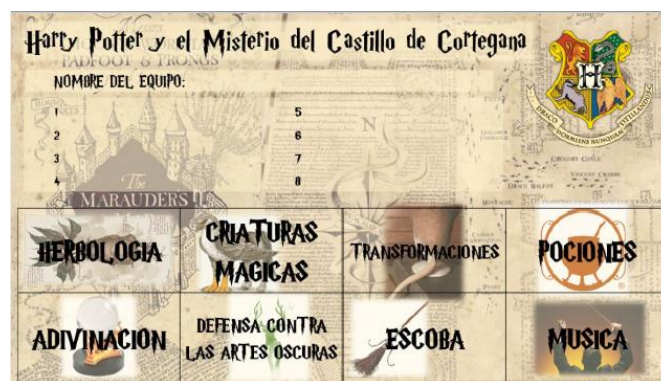
Figura 3. Ficha 1 entregada a los alumnos.

A cada grupo se le facilita dos fichas (Figura 3 y Figura 4), las cuales deben de rellenarlas cada vez que superen las pruebas.