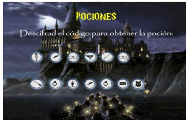
Figura 4. Ficha 2 entregada a los alumnos.