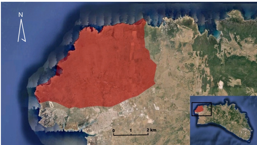
Figura 1. Localización de Punta Nati