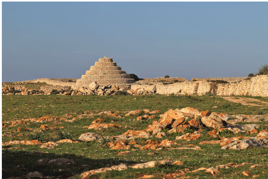
Figura 3. Barraques