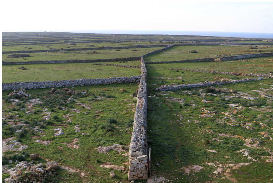
Figura 2. Muros de piedra en Punta Nati

Fuente: fotografía de los autores (20/1/2017).