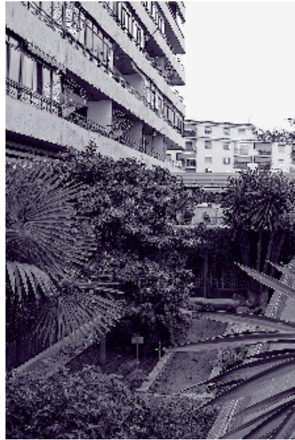
IMAGEN 9: RAFAEL DE LA HOZ ARDERIUS Y GERARDO OLIVARES JAMES, APARTAMENTOS EUROSOL, TORREMOLINOS, MÁLAGA, 1963, IMAGEN DE LAS PIEZAS CON FACHADA A LA ANTIGUA N-340. USO DE LA ESTRUCTURA METÁLICA Y EL EFECTO EN LA FORMALIZACIÓN DE FACHADA Y VUELOS. ESPACIOS COMERCIALES EN EL CAMBIO DE COTA. ARCHIVO ESTUDIO RAFAEL DE LA HOZ.

El conjunto Eurosol es en los años sesenta de una factura impecable, comenzando por una distribución acertadísima de las masas construidas en el paisaje, pasando por la aplicación de las investigaciones del autor en el campo de la vivienda mínima adaptada al uso turístico, un uso de las técnicas de construcción en acero desde una optimización certera que no por ello desaprovecha sus posibilidades