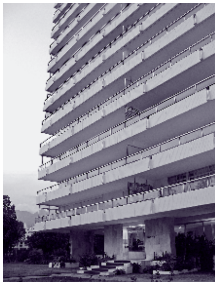
IMAGEN 5: TORRE REAL. DETALLE DE LA ZONA BAJA DE LA TORRE DONDE SE APRECIA LA LIBERACIÓN DE LA PLANTA BAJA.

En Torremolinos y a pesar que los organismos competentes intentaron prohibir su construcción, se logra concluir un proyecto de 21 torres residenciales de 15 plantas, en una promoción de capital extranjero y en el marco de un concurso de ideas. Proyectado por el arquitecto Antonio Lamela, las torres del Conjunto Playamar vuelven a ser fieles a la liberación de la planta baja, y de nuevo los elementos estructurales, en este caso, pantallas de hormigón armado abujardado, se conciben desde su capacidad escultórica.