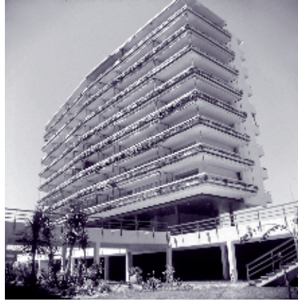
IMAGEN 10: ANTONIO LAMELA MARTÍNEZ, CONJUNTO LA NOGALERA, TORREMOLINOS, MÁLAGA, 1963, PATIO QUE CONECTAN LA PLANTA COMERCIAL Y LOS EDIFICIOS RESIDENCIALES. NOVIEMBRE 2006, COLECCIÓN ARQESTUDIO.

El conjunto Eurosol es contemporáneo a las propuestas realizadas en la misma localidad por el arquitecto Antonio Lamela Martínez, con un paralelismo interesante en sus propuestas para la incorporación de la zona comercial como un basamento de las piezas residenciales, el uso generalizado de la terraza como elemento diferenciador de la arquitectura turística, que permite unos resultados