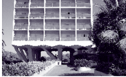
IMAGEN 3: HOTEL DON CARLOS, IMAGEN DE LA ESTRUCTURA DE PILOTIS Y LOSA ALABEADA QUE CONFORMAN EL ACCESO. SEPTIEMBRE 2006.

Cuando se construyó la obra, -el encargo se realiza en 1963, la licencia de obras se concede en 1964 y la obra se termina alrededor de 1968- fue una de las obras de mayor presupuesto de todo el país. 16 La oficina técnica de la cadena también se encargó de la decoración interior, que se realiza de