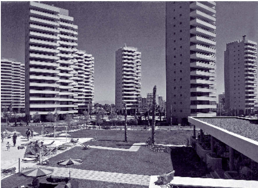
IMAGEN 7: ANTONIO LAMELA MARTÍNEZ, URBANIZACIÓN PLAYAMAR, TORREMOLINOS, MÁLAGA, 1963. IMAGEN DEL CONJUNTO. ARCHIVO ESTUDIO LAMELA.

Para finalizar este recorrido por las arquitecturas que optaron por la construcción en altura y cuya calidad quedaron “sepultadas bajo la sombra proyectada por el desarrollismo en el litoral malagueño”, como apúntabamos en el resumen, el proyecto del Conjunto Eurosol en el borde Oeste de Torremolinos se conforma como un caso paradigmático. El arquitecto Rafael de la Hoz Arderius y Gerardo Olivares James realizan en 1963 un conjunto residencial de carácter turístico en Torremolinos. Se trata de la ordenación de un solar en el borde Oeste del municipio, en un solar limítrofe en su borde norte con la entonces N-340 -actual Avda. Carlota Alessandri. La operación ordena 45.232,42 metros cuadrados de terreno en pleno borde litoral con una pendiente hacia el mar, habiendo como única preexistencia arquitectónica el Hotel Pez Espada, obra como hemos apuntado anterior-