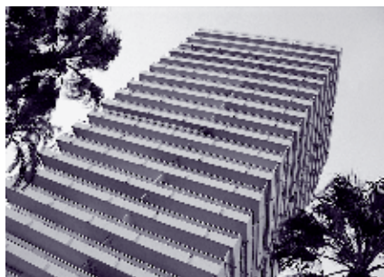
IMAGEN 6: TORRE REAL. LA HORIZONTALIDAD DE LAS BLANCAS TERRAZAS CONTEXTUALIZA LA TIPOLOGÍA VERTICAL DE LA TORRE DE VIDRIO.