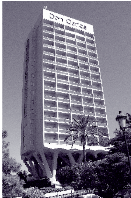
IMAGEN 2: HOTEL DON CARLOS, IMAGEN GENERAL DE LA TORRE, ALZADO OESTE, SEPTIEMBRE 2006.

El elemento vertical alberga además los espacios más representativos del hotel; la torre se levanta sobre cinco pilotis para configurar bajo ésta el acceso rodado, incorporando de esta manera el automóvil a la iconografía moderna y elitista de la Costa del Sol. La carretera es, desde el origen de la ocupación turística de este fragmento del litoral andaluz el elemento vertebrador de la operación, influyendo a priori en la localización de estas piezas arquitectónicas y teniendo en el automóvil el medio de desplazamiento, el icono obligado en la conformación de este singular modelo urbano. El vestíbulo queda así mismo acogido en el ámbito bajo la torre de habitaciones.