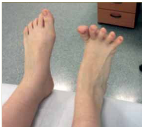
Imagen 5. Examen motor para valorar la capacidad motora del abductor del quinto dedo

era posible o si es capaz de reproducirlo en el miembro contralateral. En algunos casos se han descrito insuficiencia de la flexión plantar de los dedos. El signo de Tinel: Suele ser negativo en esta patología, en este cuadro se utiliza la maniobra de Phalen para reproducir el cuadro, realizando una flexión plantar y una inversión. Como pruebas complementarias están la radiografía, TAC, RNM, ecografía, electromiografía y pruebas de conducción sensorial. Por último es preciso realizar un buen diagnóstico diferencial 5, 13-14, 23, 25, 28 con los diferentes tipos de talalgias.