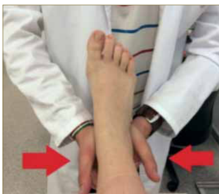
Imagen 4. Valoración del dolor a través de la compresión del talón.

El diagnóstico es primordialmente clínico, a través de una exhaustiva exploración física y un buen diagnóstico diferencial con otras patologías. Una exploración exhaustiva realizando diferentes maniobras, como la palpación en el origen del abductor o en la tuberosidad medial del calcáneo para reproducir los síntomas, así como de la fascia plantar para ver una posible asociación con una fascitis plantar, además se realizará una compresión en el talón a nivel lateral y plantar para ver si refiere dolor (Imagen 4). Se valorará la presencia de pronación del retropie, presente en exceso en los casos de atrapamiento.