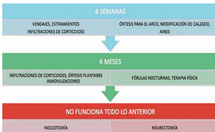
Imagen 6. Tratamiento del dolor plantar 30 .

El tratamiento debe abordarse desde un punto de vista conservador y si fracasa realizar un abordaje quirúrgico. Como tratamiento conservador está el farmacológico y el ortopodológico, fundamental, con órtesis plantares que controlen la pronación excesiva de retropie, con un soporte del ALI, además se puede realizar una modificación de la horma del zapato o utilización de taloneras. La utilización de prótesis nocturnas también presenta un buen resultado. También se pueden indicar las infiltraciones de corticoides, fisioterapia, y tratamiento osteopático. Los pacientes que presenten un cuadro combinado con fascitis responden mejor a este tratamiento conservador, en caso de pasar unos 6-12 meses y no responder, se procede a una infiltración de corticoides y anestésico con una doble función terapéutica y diagnóstica. Al tratarse de una patología que cursa con dolor de talón, se ha descrito un algoritmo terapéutico para el tratamiento 4, 5, 13, 22, 24, 25, 27-30 del mismo y que debemos de tener en cuenta y seguirlo (imagen 6).