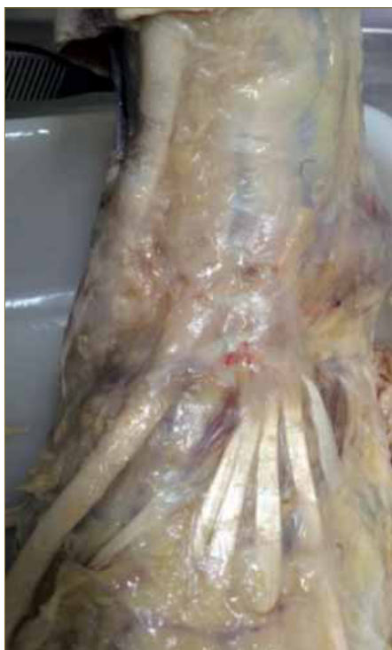
Imagen 3. Diseción anatómica de la zona habitual del síndrome del túnel tarsiano anterior.

En 1968 Marinacci, describe el atrapamiento del nervio peroneo profundo bajo el retináculo de los extensores inferior (Imagen 3) La compresión del nervio se encuentra también por debajo de la zona superior del retináculo, por donde cruza el tendón del extensor largo del primer dedo o bajo el tendón del extensor corto del primer dedo. Se produce en esta zona porque se trata de una localización muy desprotegida y es susceptible de recibir traumatismos o factores irritantes 4-5, 13-16, 20-22 .