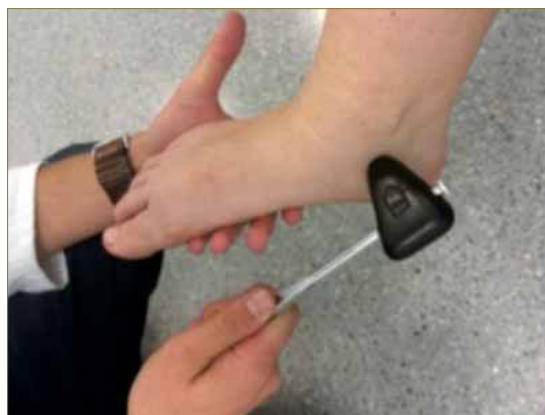
Imagen 2. Exploración del signo de Tinel.

El diagnóstico de esta patología es fundamentalmente clínico, presentándose la mayoría de los casos de manera unilateral. En la exploración se puede encontrar dolor plantar tipo quemazón a lo largo del recorrido nervioso que se manifiesta por la noche y al caminar, para reproducir los síntomas usaremos una maniobra de dorsiflexión-eversión. Se usan diferentes exámenes nerviosos para valorar tanto la sensibilidad como afectación motora. Sin embargo, la prueba clínica más importante es el Signo de Tinel, que consiste en la reproducción de la sensación dolorosa realizando una percusión sobre el recorrido nervioso. Dicho test se realiza golpeando detrás del maléolo interno (Imagen 2), si el test es positivo, el paciente percibe una sensación eléctrica que recorre todo el trayecto nervioso, llegando hasta el ALI, planta del pie, incluyendo el talón a nivel distal, y no pasando de la rodilla en la porción proximal.