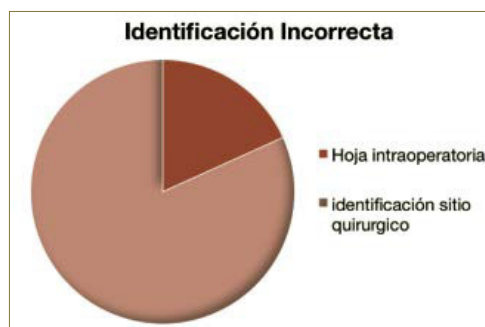
Gráfico 3. Identificación incorrecta.

De este último grupo de identificación incorrecta, un 1,5% se debe a una equivocación en la Hoja intraoperatoria de quirófano y un 11,2% o lo que es lo mismo, 15 en valores absolutos no se encuentra identificado el sitio quirúrgico (Gráfico 3).