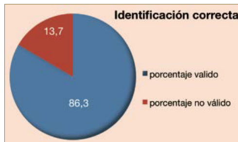
Gráfico 1. Porcentajes de identificación correcta.

En el siguiente gráfico se recogen los porcentajes que se muestra en las Historias Clínicas revisadas con identificación correcta del sitio quirúrgico, siendo el porcentaje válido de 86,3% y de 13,7% en las que se identificó de forma incorrecta el sitio quirúrgico. Estos resultados se muestran en valores absolutos en la gráfica 2 que corresponden a 117 y 17 respectivamente.