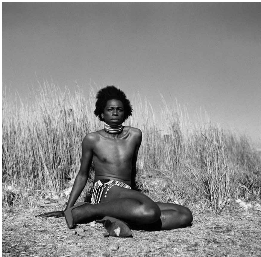
Figura 3 - Zanele Muholi. Serie Beulahs. Miss D'vine I , 2007.