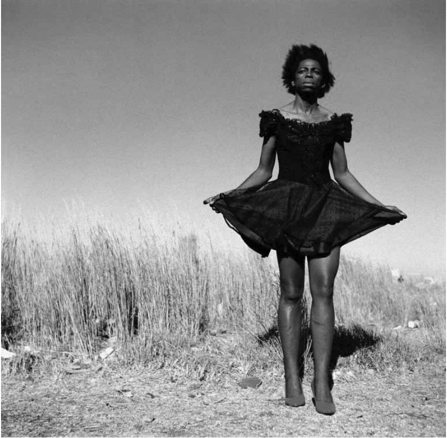
Figura 4 · Zanele Muholi. Serie Beulahs . Miss D'vine II , 2007.