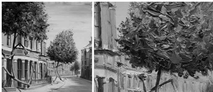
Figura 4 · Paco Pomet, Zzzz . Óleo sobre lienzo, 40 × 40 cm. (2009).