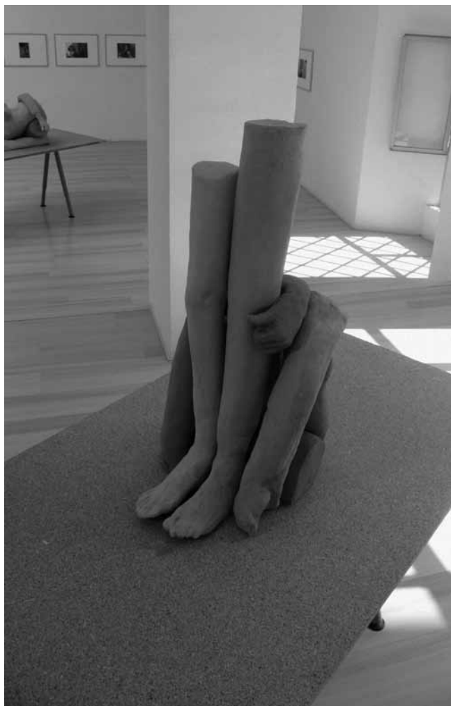
Figura 10 · MP&MP Rosado. Contengo multitudes... 2011. 90 x 60 x 60 cm. 3 piezas. Arcilla cocida y resina acrílica, madera y metal. Colección del autor.