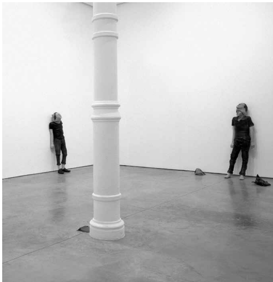
Figura 1 · MP&MP Rosado. La intimidad , 2002. Medidas variables, 5 piezas. Arcilla cocida, pintura y fotografía blanco y negro. Colección Centro Andaluz de Arte Contemporáneo. Sevilla. CAAC Colección Centro Andaluz Contemporáneo. Málaga. CAC.