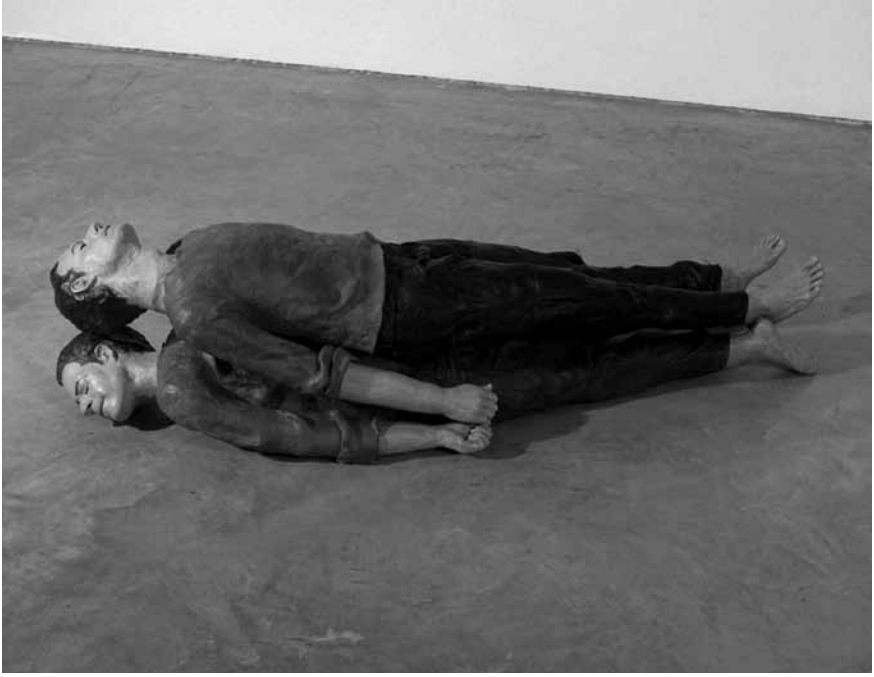
Figura 2 · MP&MP Rosado. Afecto . 2002. 46 x 60 x 180 cm. 2 piezas. Arcilla cocida, pintura y fotografía blanco y negro. Colección Diputación de Málaga.