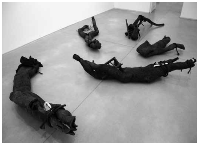
Figura 6 · MP&MP Rosado. Limbo . 2005. Dimensiones variables. Resina, tejido, madera y wallpaper. Centro de Arte Santa Mónica.