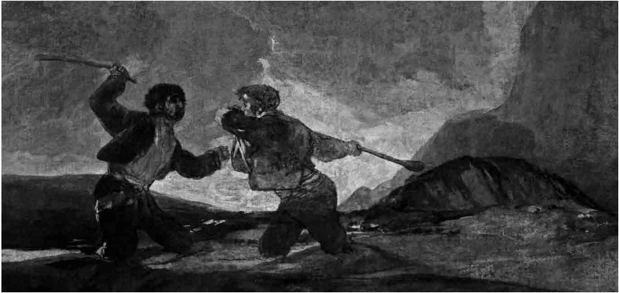
Figura 3 - Jake & Dinos Chapman. Nobody knows why . Intervención sobre estampa original. Aguafuerte sobre papel, 2003. 17,2 x 222 cm.