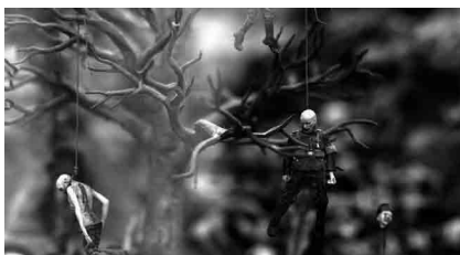
Figura 5 · Jacke & Dinos Chapman. Hell (detalle). Técnica mixta. 2000.