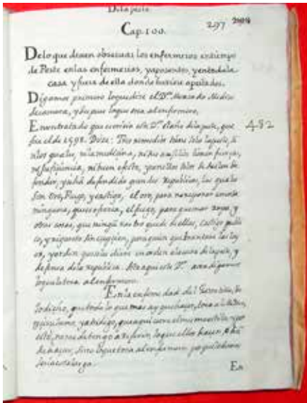
Ilustración 2. Capítulo 100 del tratado Directorio de Enfermos que da inicio a los siete que dedica al tratamiento de la enfermedad de la peste en los hospitales.

Las pomas, ideadas para evitar el contagio, se hacían de metal, generalmente de plata, o, si no se podía, de madera de enebro, limón grande o camuesa, 29 igualmente grande. Debían ser redondas y agujereadas, del tamaño aproximado de una “bola de truco”. Una vez realizados los agujeros en el limón o camuesa, se introducían por ellos clavos de especias y ramitas de canela, previamente mojados en agua y vinagre rosado y, si pudiese, además, algunos granos de ámbar o almizcle. Todo ello aderezado con polvos de rosas, violetas, claveles de nenúfar, llamados “higos de río”, echándole pepitas y cáscaras de cidra y de limones mezclados con babazas de alquitira 30 que haya estado previamente en remojo en agua y vinagre rosado. Finalmente, se le añadía un poquito de láudano, haciendo poma.