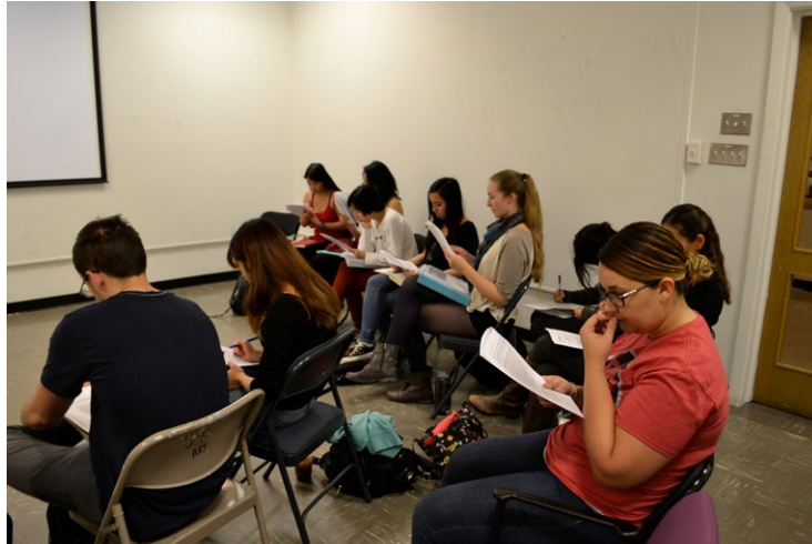
Figura 1. Debate del taller realizado en la UC Berkeley en 2016.