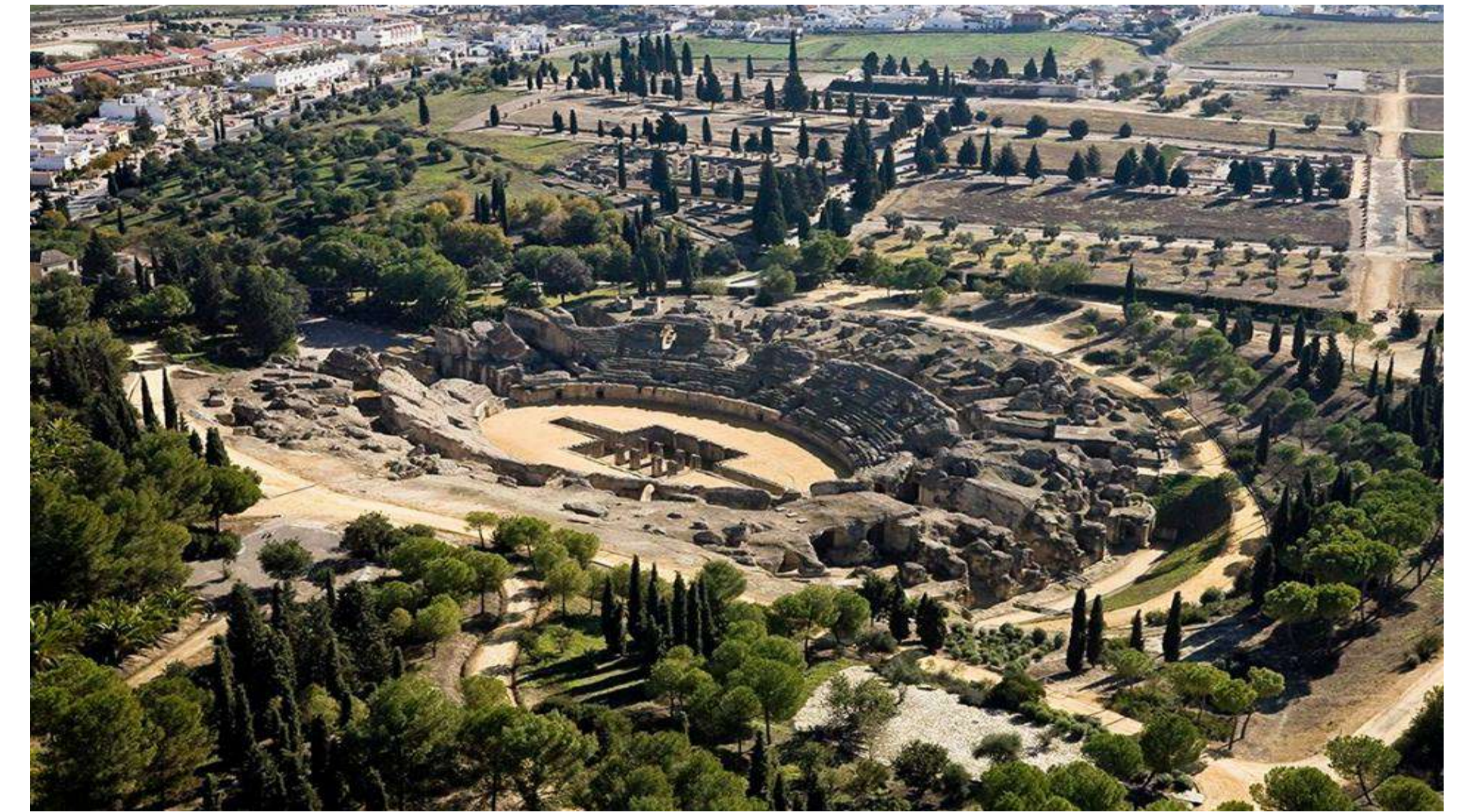
1. Recinto arqueológico de Itálica

El proyecto surge de la necesidad de generar un espacio receptivo de los visitantes al yacimiento arqueológico, un edificio que sirva como transición entre dos realidades diferentes y funcione como algo más que una puerta de acceso al recinto, que sea el escalón por el cual adentrarse antes de encontrarte con la ruina.