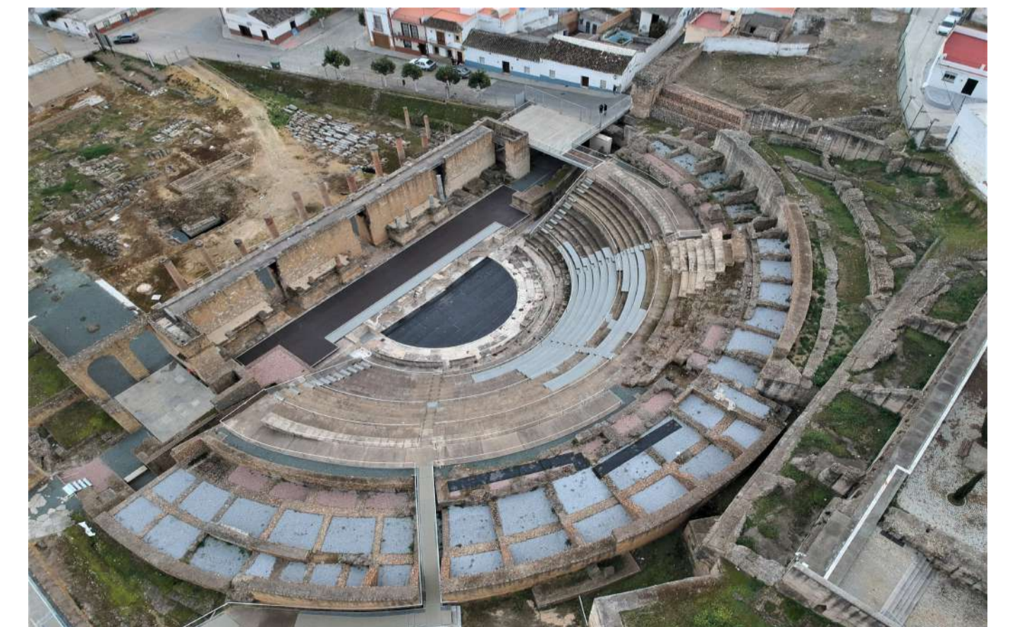
2. Teatro romano. Calle Eduardo Ybarra, Santiponce.