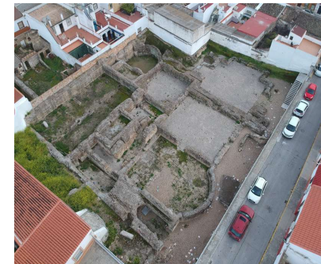
3. Termas menores. Calle Adriano, Santiponce.