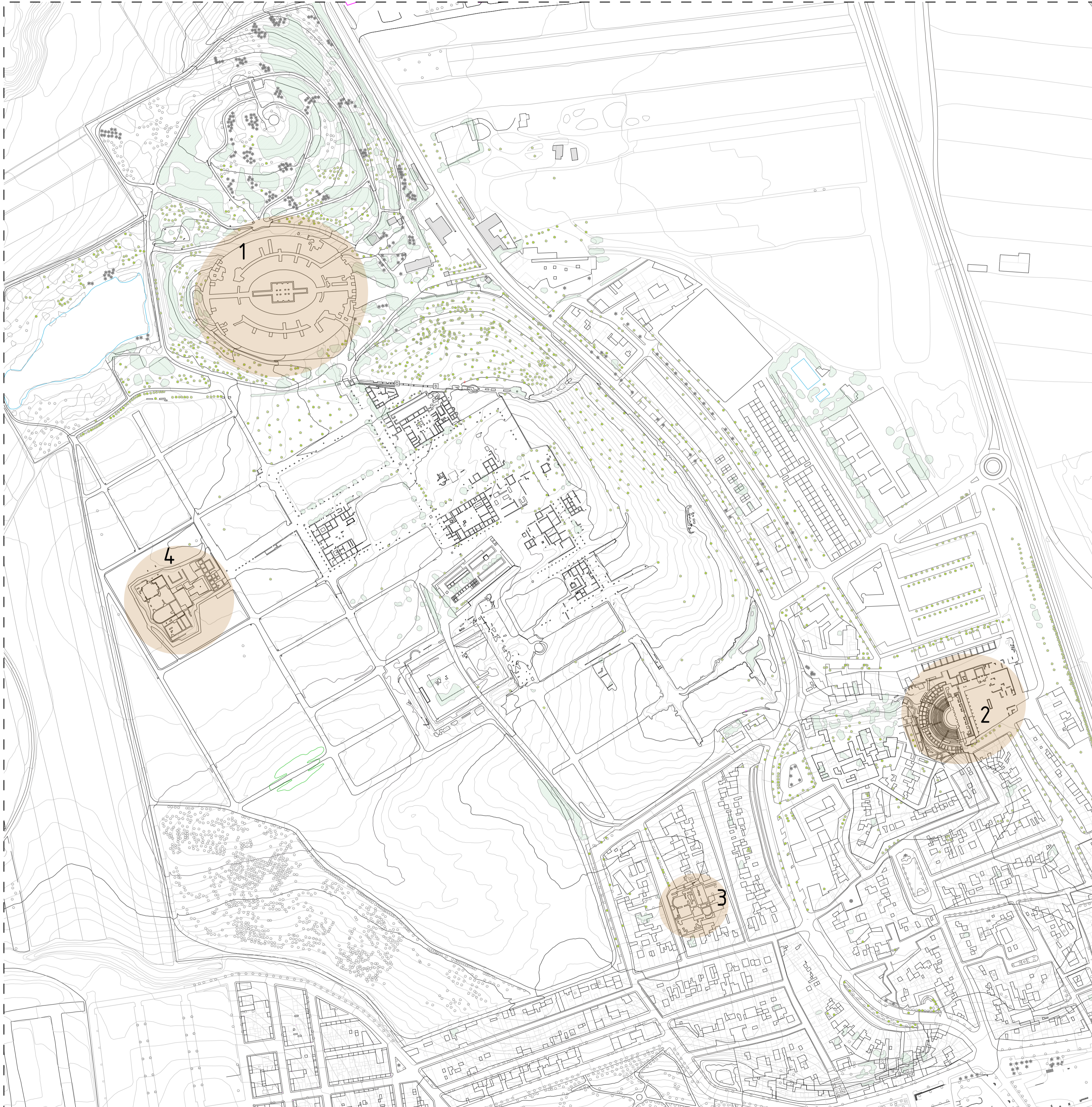
Planta de situación