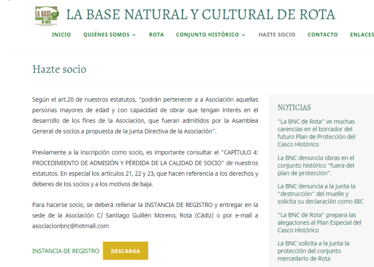
Ilustración 15. Apartado "hazte socio" .