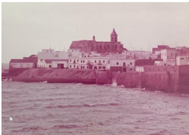
Ilustración 9. Fotografía antigua de la bahía.