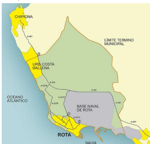
Ilustración 2. Término municipal de Rota.

Cabe destacar los valores paisajísticos que su situación geográfica le proporciona, además de culturales e históricos, puesto que, siendo una ciudad costera, fue atractiva para distintas