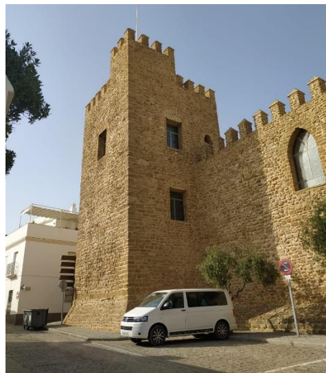
Ilustración 3. Exterior del Castillo de Luna.

· Castillo de Luna: Se trata de uno de los monumentos principales de Rota por su gran valor histórico y arqueológico. Fue declarado en ruinas en 1902, donde se construyó la capilla del colegio de San Ramón en 1951. No es la única transformación que sufre el castillo, pues a pesar de la Ley de Protección de Castillos Españoles, en 1987 comienza un proyecto de remodelación interior con el objetivo de convertirlo en palacio municipal sin estudios arqueológicos previos. Una vez transformado fue declarado Bien de Interés Cultural como monumento en 1995 (Ruiz de Lacanal, 2018).