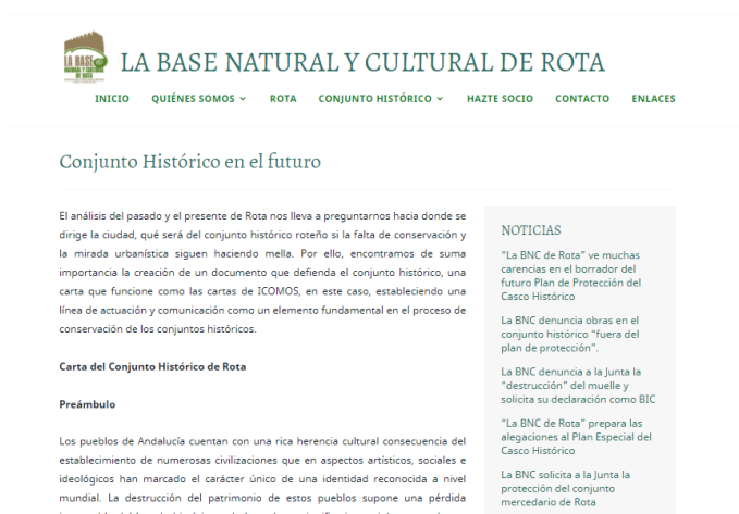
Ilustración 14. Fragmento de texto en el subapartado Conjunto Histórico en el futuro .