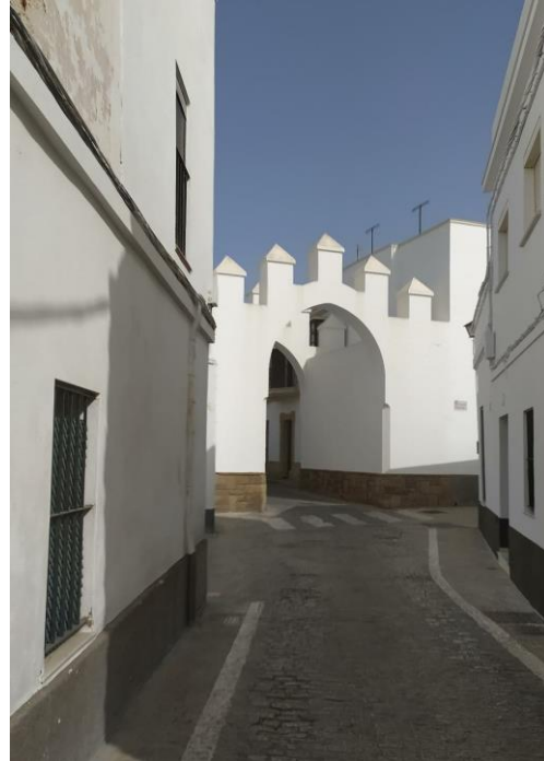
Ilustración 6. Arco de Regla en la actualidad.

• Muelle de Rota: Es una de las construcciones más antiguas de Rota. Se trata de una pieza patrimonial de gran valor etnológico pues representa gran parte de la cultura, actividades y formas de vida de la ciudad. Muelle que antiguamente permitía que el agua entrase hasta la Puerta del Mar y donde los roteños contemplaban la estampa de los barcos que antes faenaban cerca de la costa (Ruiz de Lacanal, 2018).