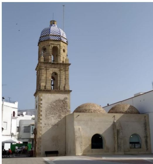
Ilustración 4. Torre del antiguo convento de la Merced.

· Convento de la Merced: El antiguo convento de los Mercedarios Descalzos originalmente formado por dos claustros, una bodega, una panadería y el propio convento, llega al siglo XX muy transformado. Durante la desamortización fue vendido en subasta pública y más tarde declarado en ruinas. En 1929, el claustro pequeño del convento se transforma en un mercado público y llega a 1992 con partes cerradas y partes transformadas en bodega, viviendas y posteriormente bares y cine. A partir de este momento, se expropia y se venden parcelas, quedando la torre de la Merced, las bóvedas y el espacio de la antigua ermita de la Veracruz. Actualmente en el espacio que ocupaba el antiguo convento se encuentra un aparcamiento (Ruiz de Lacanal, 2018).