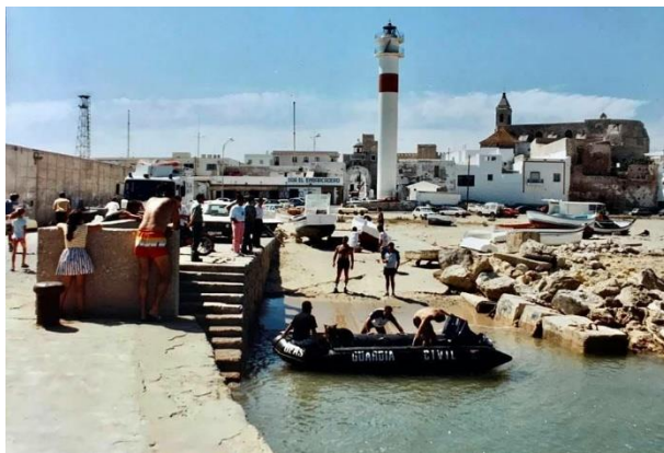
Ilustración 7. Fotografía antigua del muelle.