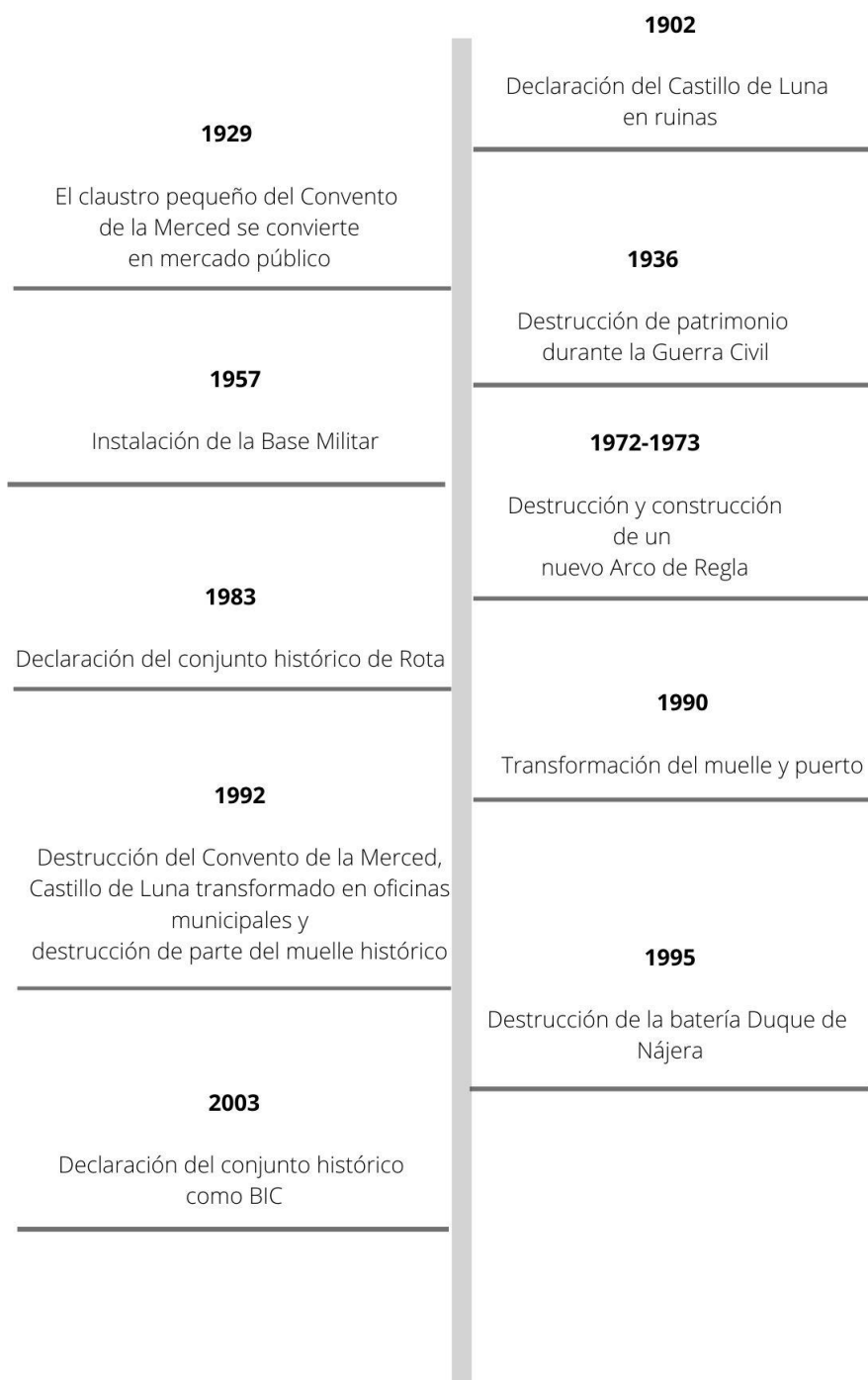
Ilustración 11. Línea del tiempo de Rota en el pasado. Autora: Laura Martín Gallardo, 2020.