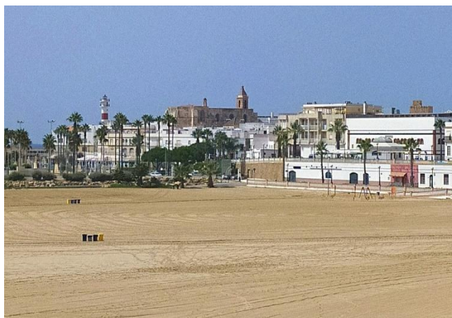
Ilustración 10. Bahía en la actualidad.

Las transformaciones son numerosas: la batería de la O transformada en biblioteca pública, el baluarte Salazar, el baluarte Veracruz y el baluarte del Duque de Nájera destruidos para la construcción de empresas turísticas 13 en 1995, la reconstrucción de la puerta de San Cayetano, la construcción de numerosas casas para la Armada, etc.