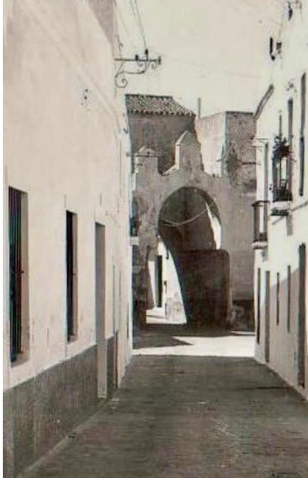
Ilustración 5. Imagen antigua de la puerta de Regla. Recuperado de: https://es-es.facebook.com/groups/59738763954/