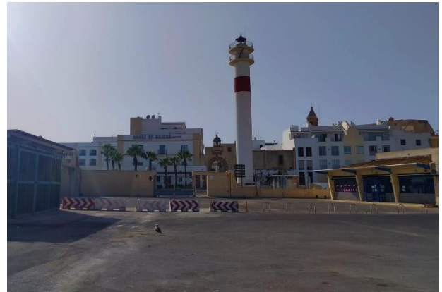
Ilustración 8. Muelle en la actualidad.