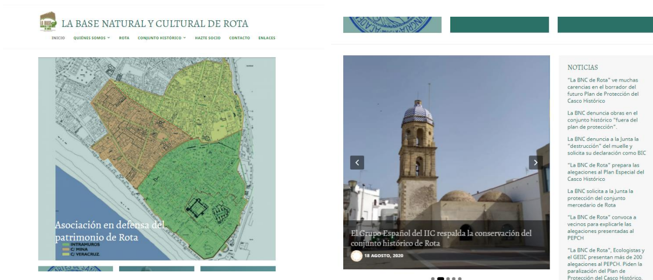
Ilustración 12 y 13. Alguna de las partes de la página de inicio.