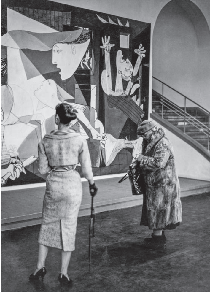
Vista de Guernica en la exposición Picasso, Rheinisches Museum, Colonia, 1956