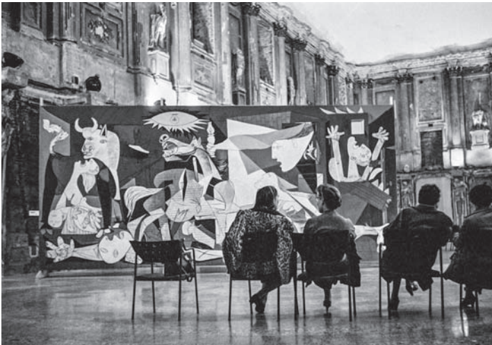
Vista de la exposición Picasso , Palazzo Reale, Milán, 1953