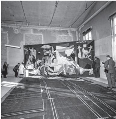
Montaje de Guernica , Exercishallen, Estocolmo, 1956

una muestra “no teatral” y “desinteresada”, con escasa presencia de los primeros periodos de Picasso. Esto respondía en parte a que la Unión Soviética no prestó sus cuadros (emigrados rusos