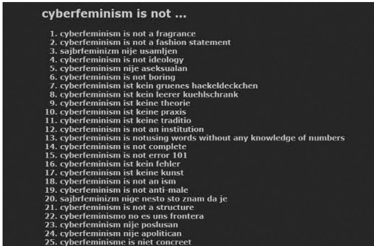
Figura 4: "100 anti-theses cyberfeminism is not...". Documenta X de Kassel (1997).

al mismo tiempo, de ahí el haber elegido como marco la Documenta de Kassel.