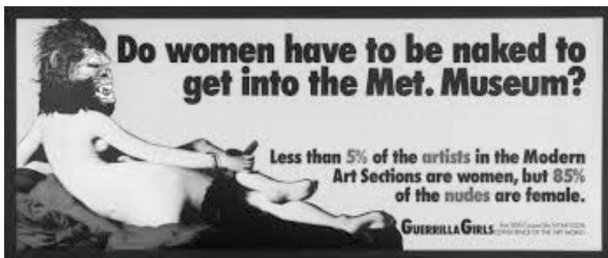
Figura 3: Guerrilla Girls. Met. Museum (1985).