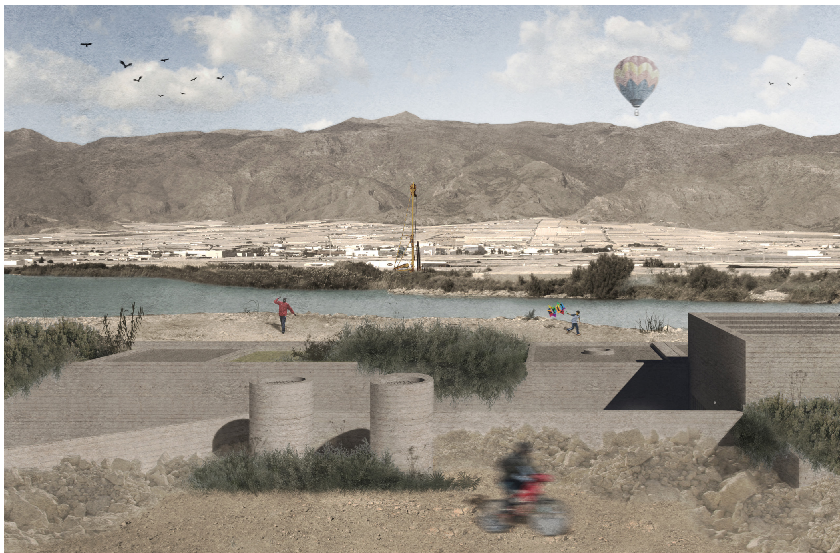
*Paisajes generados con la Balsa del Sapo y la Sierra de Gádor de fondo