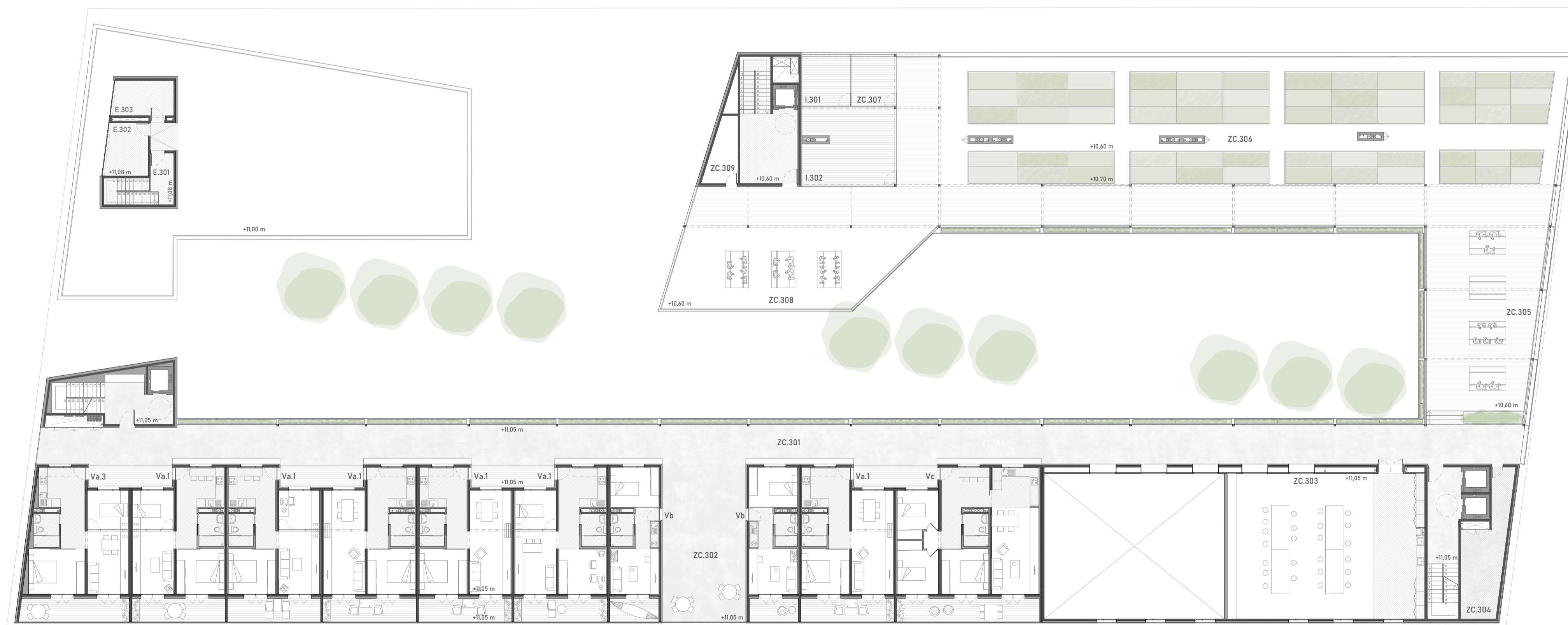
PLANTA TERCERA (+11,05m)_ E 1/200