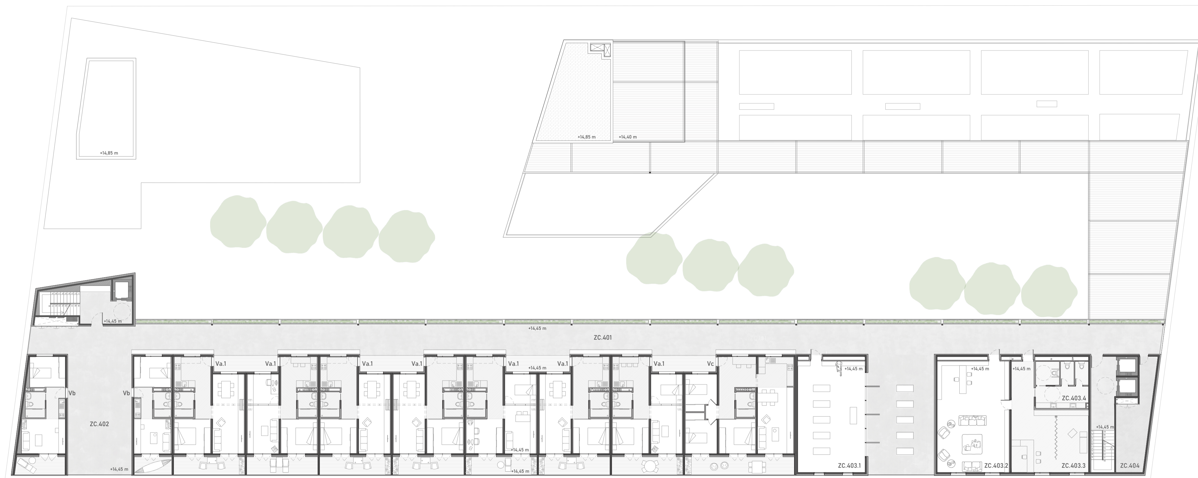
PLANTA CUARTA (+14,45)_ E 1/200