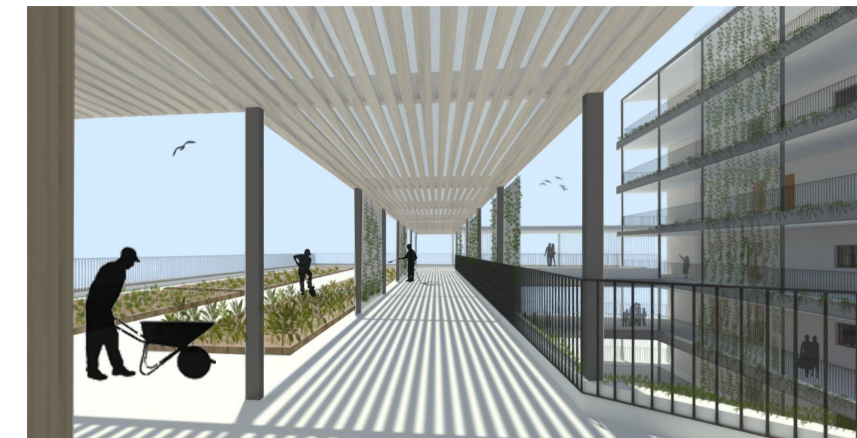
PERSPECTIVA DESDE PLANTA 3º DE CUBIERTA. ZONA DE HUERTOS Y ESTANCIA.