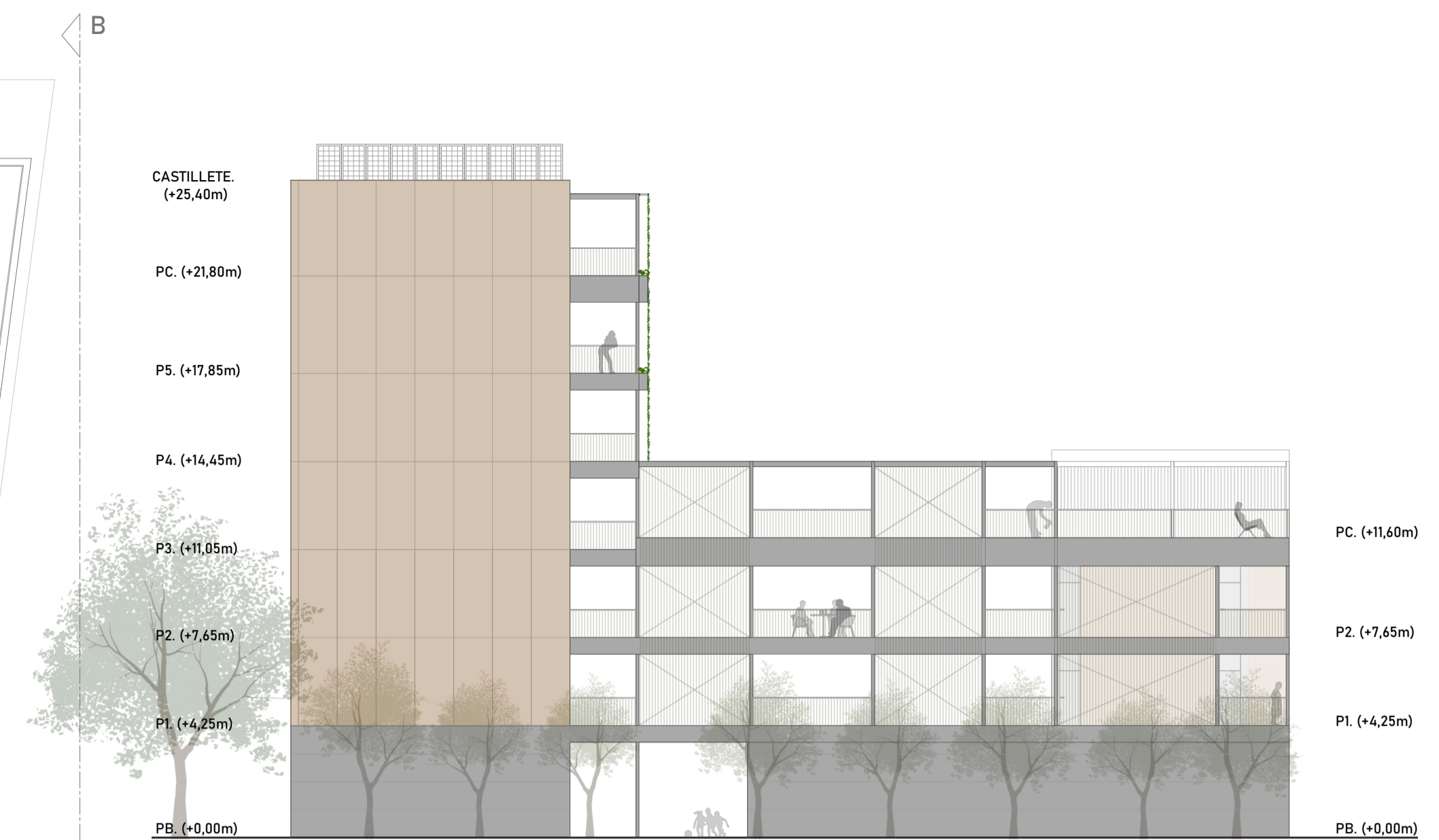
B-B' ALZADO SUR_ E 1/200