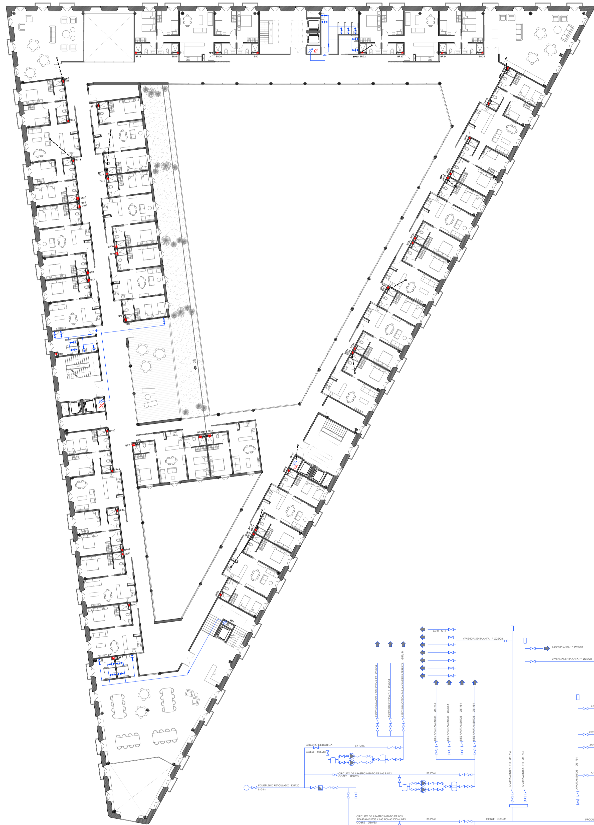
PLANTA PRIMERA ESCALA 1/250