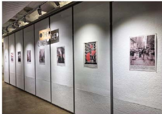
"Other Urban Landscapes" Project. AAP NYC Cornell University. Final Presentation, December 2018.