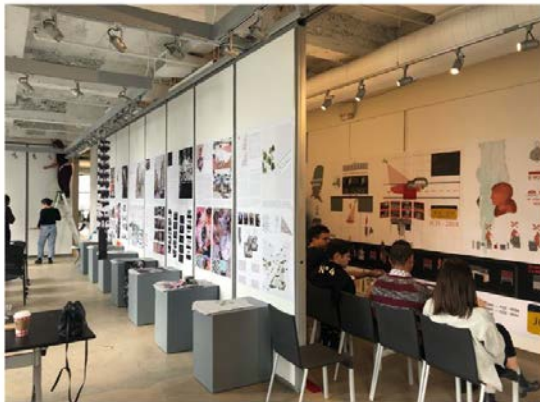
Working on "Other Urban Landscapes" Project. AAP NYC Cornell University. Final Presentation, December 2018.