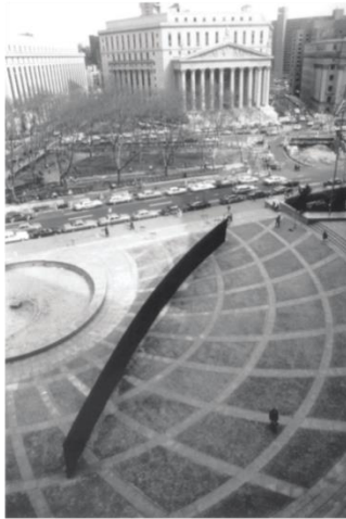
Tilted Arc , 1981. Federal Plaza in Lower Manhattan, New York. Image Archive.

3) Seminarios: Además, se celebraron cuatro seminarios dedicados a estudiar en profundidad los conceptos de Ciudad Creativa y Regeneración Urbana Creativa. Los participantes trabajaban en grupo en cada una de las lecturas previstas y colaborativamente analizaban y preparaban una presentación sobre los aspectos más específicos y relevantes según su criterio. Tenían además que buscar un proyecto real reciente donde esa teoría se hiciera visible. Los cuatro seminarios abordaban las siguientes lecturas y conceptos: