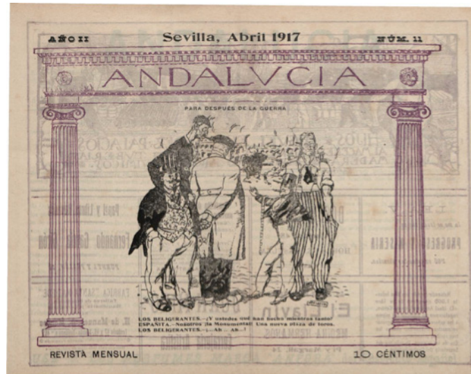
Figura 4. Viñeta de Juan Lafita en la revista Andalucía nº 11, abril de 1917

Fuente: Para después de la Guerra. Texto: Los Beligerantes.- ¿Y ustedes que han hecho mientras tanto? /Españita.- Nosotros ¡La Monumental! Una nueva plaza de toros. /Los Beligerantes.- ¡Ah! ¡Ah!