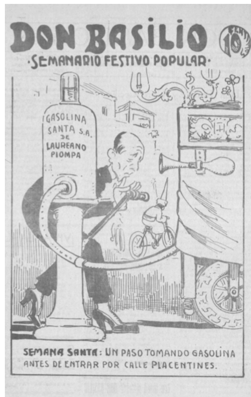
Figura 6. Portada de la revista Don Basilio , Nº 2 del 25 de octubre de 1930

El tribunal entendió que el término popular piompa (popa, parte trasera) hacía referencia a una grave ofensa. Por este hecho se solicitó 4 años, 9 meses y 11 días de destierro y a 1.650 pesetas de multa y costas por el delito de injurias grave por escrito y con publicidad, siendo condenado por injurias graves con agravante el día 18 de octubre de 1930”, (Archivo Histórico Provincial de Sevilla, fondo Audiencia Territorial, libro 3.195, sentencia 156) 18 .