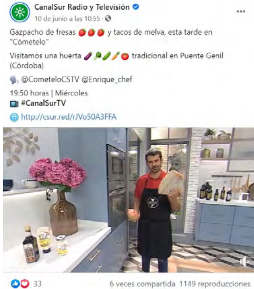
Imagen 4. Publicación en Facebook de Canal Sur sobre un programa de cocina