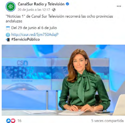
Imagen 5. Publicación en Facebook de Canal Sur relativa a un anuncio de sus servicios informativos