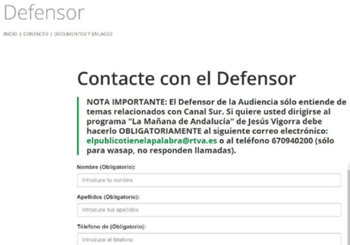
Imagen 1. Formulario de contacto con el Defensor de la Audiencia de RTVA