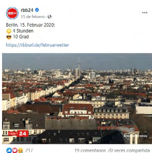
Imagen 6. Publicación en Facebook de RBB24 sobre la situación meteorológica