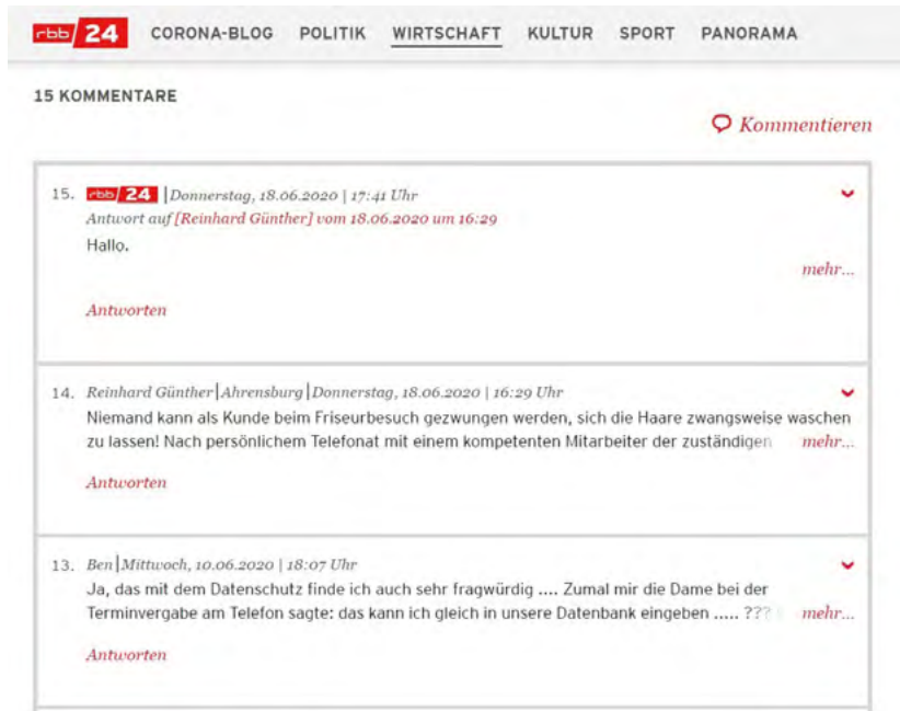
Imagen 2. Ejemplo de comentarios en una noticia de RBB sobre normas de higiene por el COVID-19