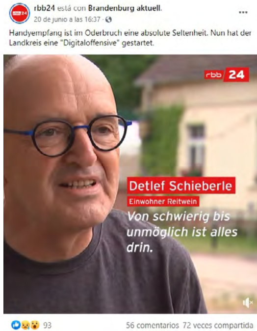
Imagen 7. Publicación en Facebook de RBB24 sobre falta de cobertura móvil en Brandeburgo