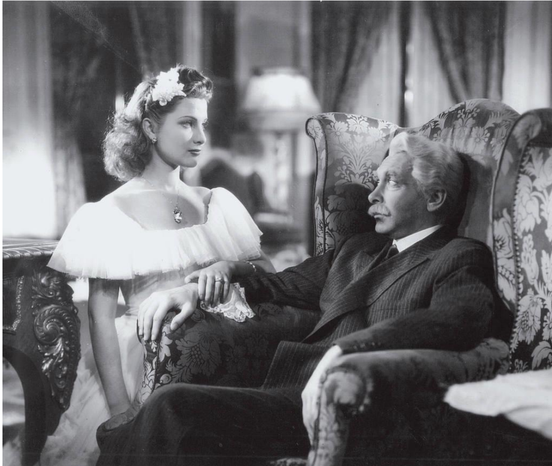
Fotograma de Aquel viejo molino : un rico emigrante regresa desde la Argentina para reconstruir el hogar familiar.

En Buenos Aires se estrena muy pronto, en mayo de 1947, y es el filme de este tipo de mayor éxito y calidad. El Heraldo dice que la película tiene interés y simpatía, buena realización y fotografía y un diálogo natural con expresiones graciosas. El crítico sitúa la acción en Andalucía. El rodaje se hace en Andalucía y La Mancha. Imparcial Film resalta la capacidad de la película para retratar la nostalgia por la tierra y los sentimientos humanos relacionados con los fuertes lazos que las personas establecen con los de su sangre y con la patria. Este canto a la emigración y a su apego por España explica que tuviese en la Argentina un gran éxito entre la colonia española, que no puede evitar las lágrimas en muchos momentos. Es más, en España la película se dio por perdida hasta que apareció una copia en, precisamente, Buenos Aires (Comas, 2002: 76).