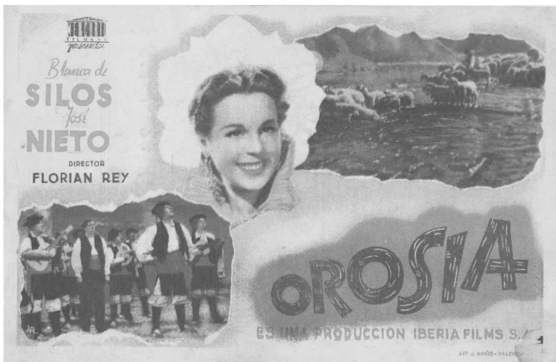
Cartel de la película Orosia con imagen de la protagonista, de una rondalla aragonesa y paisajes del Pirineo.

Orosia , por otra parte, tiene su importancia porque ejemplifica muy bien el protagonismo que en el drama rural tiene la mujer. La apelación al mundo rural por parte de la novela y el teatro no obedece solo a una corriente estética. Hay detrás un pensamiento político: un discurso nacional ruralista que exalta las virtudes campesinas y el medio rural. Antes de la guerra este pensamiento se encontraba en el catolicismo social, el ultranacionalismo y el fascismo. El franquismo lo asume y lo defiende. Pues bien, el nacional ruralista convierte a la mujer en símbolo de los valores del agrarismo y el tradicionalismo y, al mismo tiempo, le confía la defensa de esos valores frente al avance de la izquierda marxista y anarquista, el laicismo, el ateísmo, el materialismo individualista o el internacionalismo antipatriótico. Es decir, las mujeres rurales con su austeridad, fortaleza, sencillez, fe cristiana, su honra y su arraigo a la tierra se convierten en un nuevo ideal patriótico.