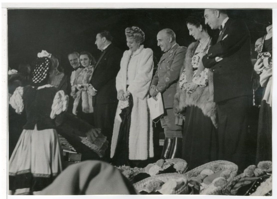
Eva Perón viaja a España en 1947. En uno de los actos preparados para ella, recibe ofrendas de las regiones. Están representadas por mujeres ataviadas con su traje regional mientras la primera dama argentina y las consortes visten pieles.

periférico y el separatismo. En las regiones, dice el régimen, reside lo más auténtico y lo más popular de una nación que, precisamente, se construye con la exaltación de lo local, lo provincial y lo regional. En sus discursos, Franco insiste una y otra vez en que para mantener la unidad de las tierras de España es preciso exaltar la rica multiplicidad de sus regiones, pues esa multiplicidad es la fuente de fortaleza de la unidad de la patria. Las películas mencionadas proyectan paisajes y costumbres de Aragón, Castilla, Extremadura o Andalucía.