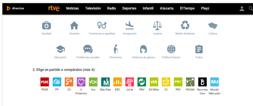
Figura 3. Comparador de Programas Electorales de RTVE.