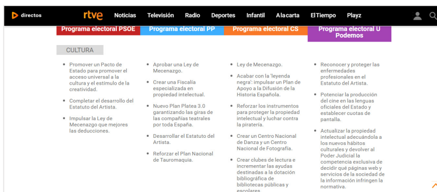
Figura 4. Comparativa entre Programas Electorales.

El resultado será la comparativa entre programas electorales en el ámbito de la cultura con el fin de observar las propuestas de cada partido (Figuras 4 a la 7).