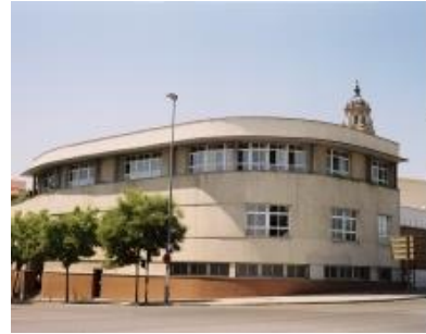
Imagen 13: Proyecto Hombre