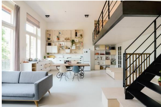
Imagen 15: Loft de lujo

La casa de paz será muy diferente a la de su familia. Tendrá un estilo moderno y lujoso, acorde con su estilo de vida de mujer de éxito. Su casa reflejará como intenta ocultar sus verdaderas raíces, rodeándose de lujo.