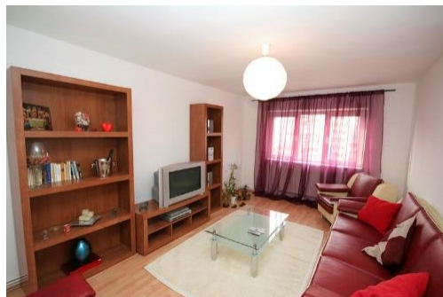
Imagen 14: Casa Humilde

Tendrá un estilo decorativo simple y minimalista, con muebles algo clásicos y de aglomerado. Plasmará el estilo de vida de la clase media.