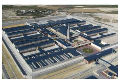
Imagen 12: El Puerto II