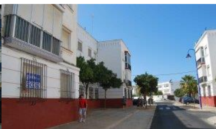
Imagen 9: Barriada Bazán (San Fernando, Cádiz)