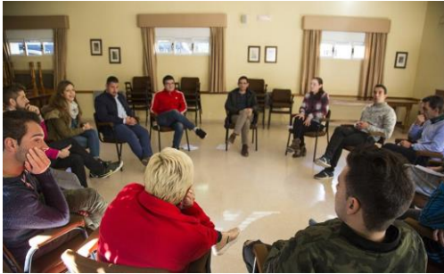
Imagen 12: Proyecto Hombre

Estará inspirado en el centro de desintoxicación Proyecto Hombre de Sevilla, equipado con habitaciones para personas que necesiten asilo, salas de terapia, despachos para los profesionales y grandes espacios para reuniones y celebraciones con los pacientes. En ningún momento se menciona que se trate de un centro de dicha asociación en concreto.