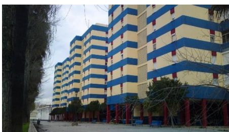
Imagen 8: Barrio La Ardila (San Fernando, Cádiz)

En cuanto a la estética, la inspiración viene de los barrios obreros típicos de la provincia de Cádiz, como la Barriada Bazán y la Ardila en San Fernando o la Barriada de Santa Ana en Chiclana de la Frontera, dos ciudades gaditanas. Una estética de barrio de clase media, con edificios antiguos de más de 45 años y vecino de clase humilde, pero sin llegar a ser marginal. En ningún momento se dirá en qué ciudad exactamente se desarrollan los acontecimientos ni el nombre del barrio.