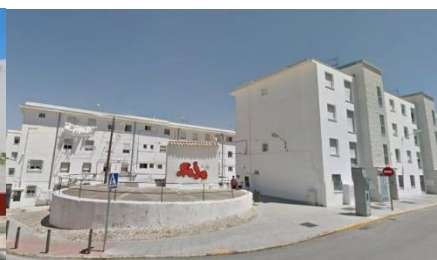
Imagen 10: Barriada de Santa Ana (Chiclana de la Frontera, Cádiz)