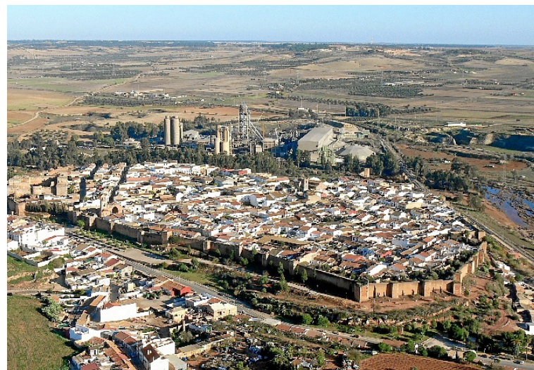
■ (12): Niebla (Huelva).