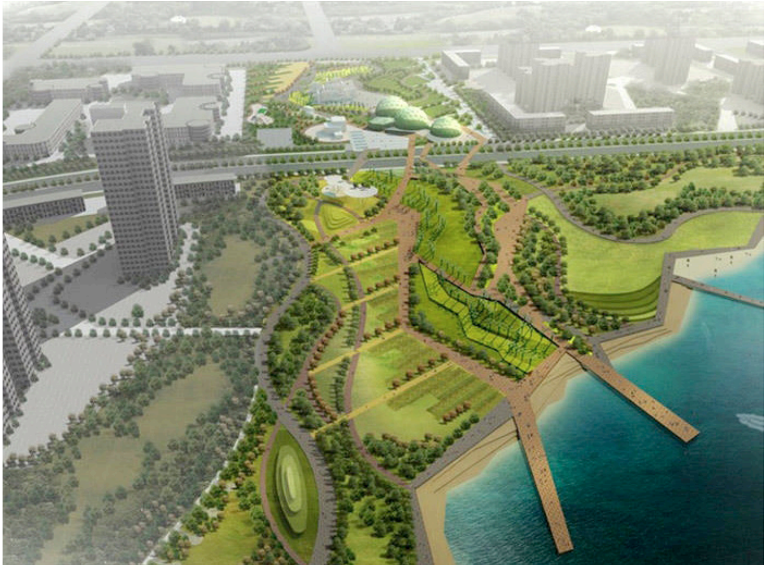
■ (19): Charter City