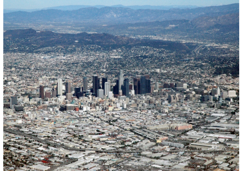
■ (15): Los Angeles.

De lo dicho en la Ley, es posible inferir que el modelo urbanístico de la ciudad futura debe establecerse en coherencia con aquél de la ciudad existente. Sin embargo, antes de determinarlo, es indispensable tomar en consideración los estudios, los análisis y las reflexiones acerca de los resultados prácticos, derivados de la aplicación de los principios preponderantes que se han tomado en cuenta para la intervención en la ciudad existente y en la ciudad propuesta, sintetizando, en cada uno de los períodos históricos: