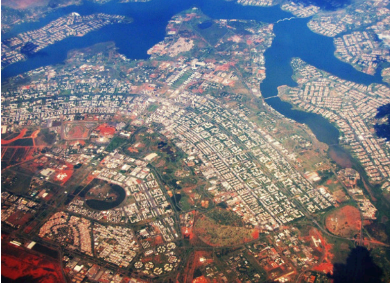
■ (14): Brasilia.