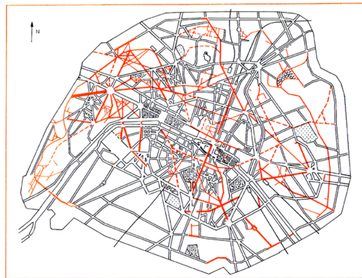
■ (13): París.