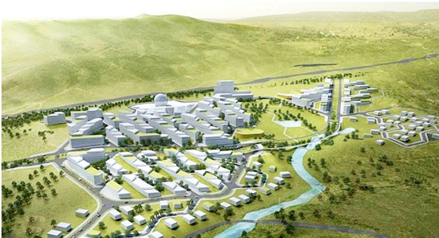
■ (i10): Smart City Portugal.

En España los planes urbanísticos, ante la crisis que vivimos tendrán que reajustar sus modelos acudiendo a todos los recursos terapéuticos y de cirugía urbanística que sea posible. Pero esto ya está en el ámbito de la intervención en la ciudad que hemos heredado construida que dispone de un indudable sobre-dimensionado de la oferta de suelo urbanizable y de residencias construidas.