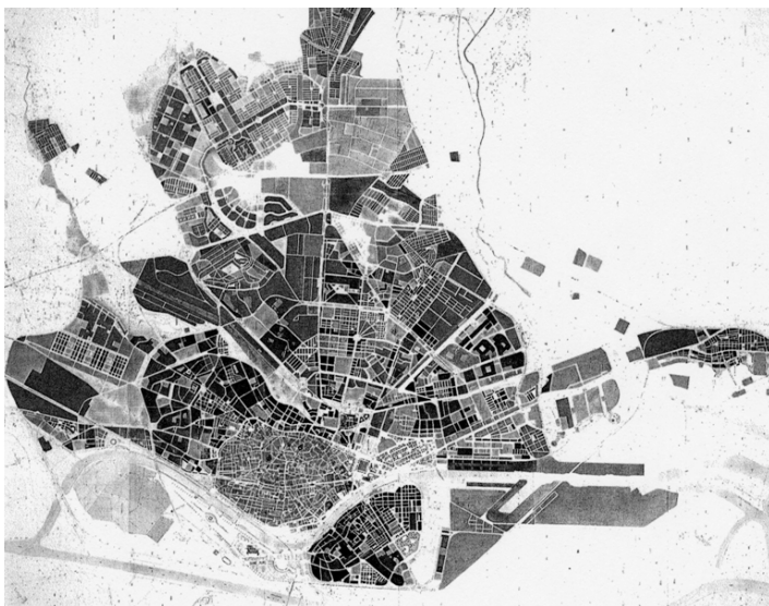
■ (16): Sevilla.