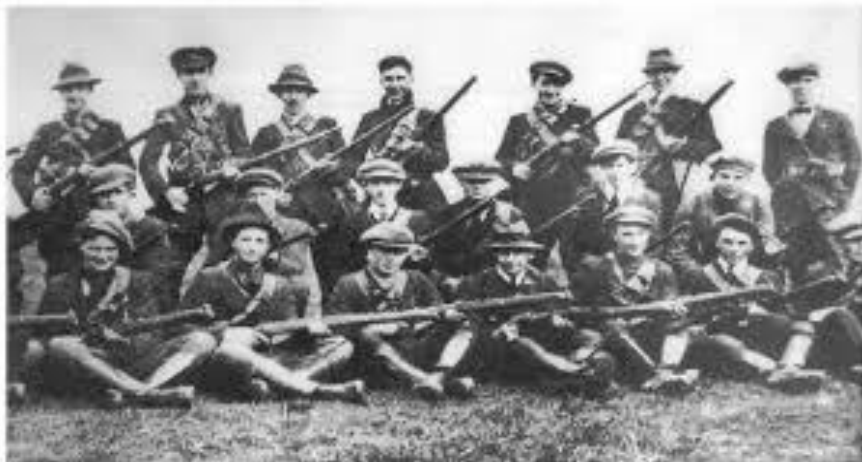
Figura 5. Soldados del Ejército Republicano Irlandés (IRA) durante la guerra de independencia (1922)

A diferencia de la guerra de independencia, esta no se libró contra la corona británica, sino entre irlandeses "pro tratado" y el bando republicano. El conflicto vio su fin en mayo del año 1923 con la victoria del bando pro tratado. Éamon De Valera, líder del bando derrotado, fundó un nuevo partido llamado Fianna Fáil que ganaría las elecciones dos años después para redactar, en 1937, una nueva constitución que reafirmaba a la iglesia católica en Irlanda y que acabó con el juramento de lealtad al rey británico (Lonleyplanet.com, 2020).