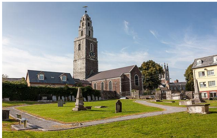
Figura 12. Iglesia de Santa Ana

Es de destacar la Iglesia de Santa Ana (Figura 12) en el barrio de Shandon, construida en 1772. Un dato curioso de la Iglesia de Santa Ana es que su campanario alberga ocho campanas que pueden tocadas por los turistas, después de subir sus 132 escalones. Además, la torre de la iglesia tiene cuatro caras con un reloj en cada una. Esta torre tiene el nombre de “la mentirosa de las cuatro caras” ya que, vista desde fuera, parece que cada reloj marque una hora distinta.