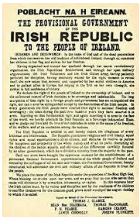
Figura 4. Declaración de independencia del Levantamiento de Pascua de 1916.

Esta revuelta no duró más de una semana, pero la dura respuesta del gobierno británico bombardeando la ciudad y ejecutando sentencias de muerte a los responsables, convirtió a estos últimos en mártires, en símbolos de rebeldía contra la opresión del Reino Unido (RTVE documentales, 2020).