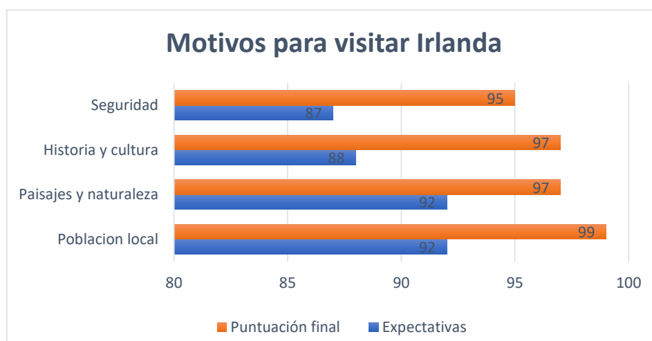
Figura 1. Principales motivos por los que los visitantes eligieron Irlanda en 2017

De hecho, en el siguiente gráfico (Figura 1), veremos los principales motivos por los que los turistas visitan Irlanda, según una encuesta realizada a finales del año 2017 por parte de Fáilte Ireland, el organismo público dedicado a la estadística del sector en el país.