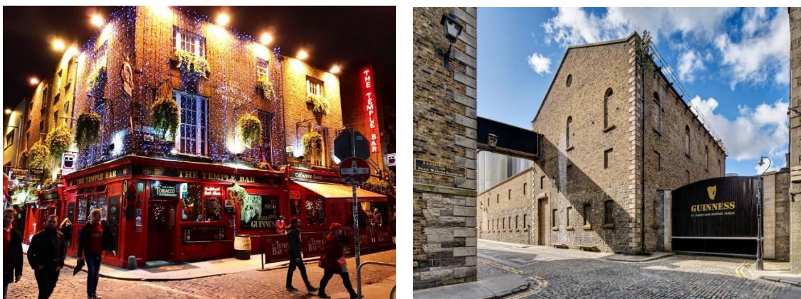
Figura 11. Temple Bar y Guinness Storehouse

Todo aficionado a la cerveza ha probado u oído hablar alguna vez de la Guinness. La icónica cerveza negra nació en St. James Gate, casco histórico de Dublín, en 1759. Este establecimiento (Guinness Storehouse, Figura 11) que desde entonces funcionó como cervecería, se ha convertido en la primera atracción turística de Irlanda, donde puedes repasar toda la historia de la marca, recibir una masterclass sobre cómo “tirar” una buena Guinness y, sobre todo, disfrutarla en su Gravity Bar 360, con unas vistas únicas de la ciudad.