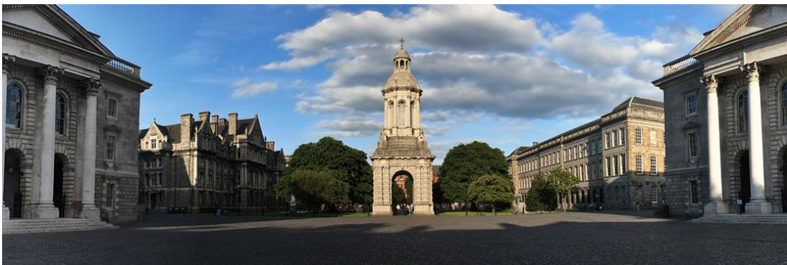
Figura 9. Trinity College

El Trinity College (Figura 9) es un campus de la Universidad de Dublín que data del año 1592. Su biblioteca es la biblioteca de investigación más grande del país y, por su gran importancia histórica, tiene el derecho legal a una copia de cada libro que se publique tanto en Irlanda como en el Reino Unido. La obra más famosa que se encuentra en esta biblioteca es el Libro de Kells, un manuscrito del cristianismo temprano que relata historias de monjes y vikingos.