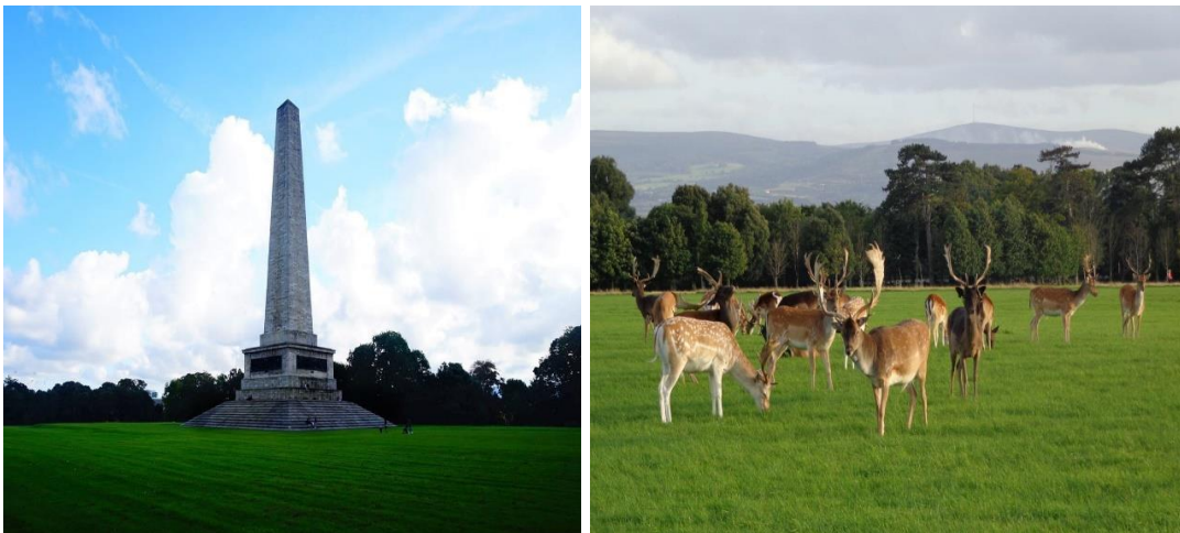
Figura 7. Phoenix Park

El Parque Phoenix (Figura 7) es el parque público más grande de Europa (712 hectáreas). En un principio fue creado como coto de caza privado para la realeza, pero poco después fue abierto al público. En este parque habita una gran diversidad de especies animales, de entre las que se destacan los Gamos, una especie de ciervo muy característico de la zona. Otras de las atracciones del parque Phoenix son el zoo de Dublín, la cruz papal y el Monumento a Wellington, un obelisco de 62 metros en memoria del Duque de Wellington. Un dato curioso es que dentro de este parque también se encuentra la Áras an Uchatán (la residencia presidencial), eso sí, en una zona privada dentro del mismo parque. En Phoenix Park se ofrecen servicios de alquiler de bicicletas y también es muy frecuente encontrar agrupaciones deportivas desarrollando sus actividades en la naturaleza.