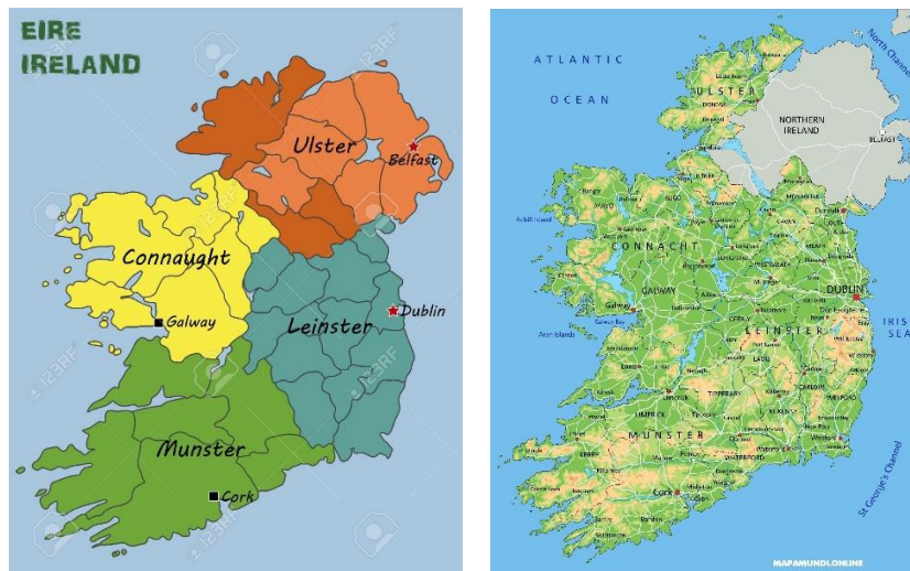
Figura 6. Mapas político y físico de la República de Irlanda

La República de Irlanda es un país miembro de la Unión Europea desde el año 1973 y sus idiomas oficiales son el Inglés y el Irlandés. Su población es de 4.9 millones de personas y la capital del estado es Dublín. El país se divide en las provincias de: Leinster, Munster, Connaught y parte de Ulster (La mayor parte de esta última pertenece a Irlanda del Norte), formando así 26 de los 32 condados que forman la isla de Irlanda (Europa.eu, 2020).