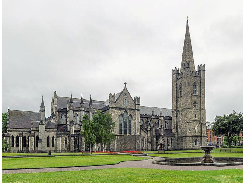
Figura 8. Catedral de San Patricio

Continuamos por las catedrales de San Patricio (Figura 8) y La Santísima Trinidad, separadas por sólo 10 minutos a pie. La primera, San Patricio, data de 1220 y fue construida junto al pozo donde el patrón de Irlanda bautizaba a los conversos. Por otro lado, la catedral de la Santísima Trinidad y su famosa cripta medieval son un gran reclamo para fieles y peregrinos.