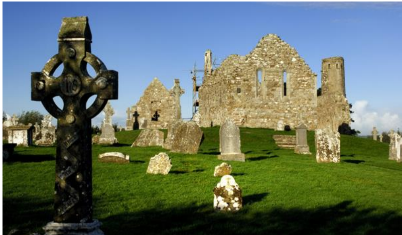
Figura 3. Vikingos en Irlanda

Brian Boru, natural de la región de Munster, fue nombrado rey absoluto de toda Irlanda en el año 1002, tras sus conquistas en el sur del país. Dos años después emprendió una gira derrotando a los ejércitos vikingos hasta que murió en la batalla de Clontarf, a las afueras de Dublín, donde consiguieron la victoria en 1014 (O'Bernie Ranelagh, J. 2014).