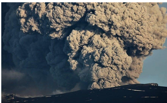
Figura 21. Erupción del volcán Eyjafallajökull, Islandia (2010)

Este último año se vio claramente afectado por la erupción de un volcán en Islandia (Figura 21). El día 15 de abril se cerró por completo el tráfico aéreo en el noroeste de Europa y los aeropuertos de Irlanda no pudieron abrir hasta finales de mes. El día 4 de mayo se produjo un cambio en la dirección de los vientos que provocó que se volvieran a cerrar los aeropuertos en Irlanda por varios días (Rtve.es, 2010).