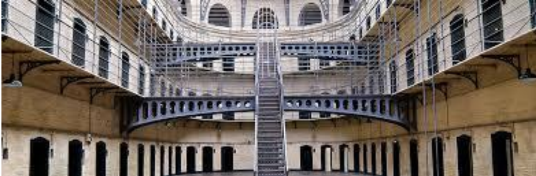
Figura 10. Cárcel de Kilmainham

La Cárcel de Kilmainham (Figura 10) dejó de funcionar en 1924. Por sus celdas pasaron prisioneros tan famosos como Éamon De Varela y los líderes del Alzamiento del Lunes de Pascua, 14 de los cuales fueron ejecutados en el Patio de los Picapedreros. Sin duda, la visita a la imponente Cárcel de Kilmainham es sobrecogedora, sobre todo por el dramatismo añadido que le aporta el tour guiado.