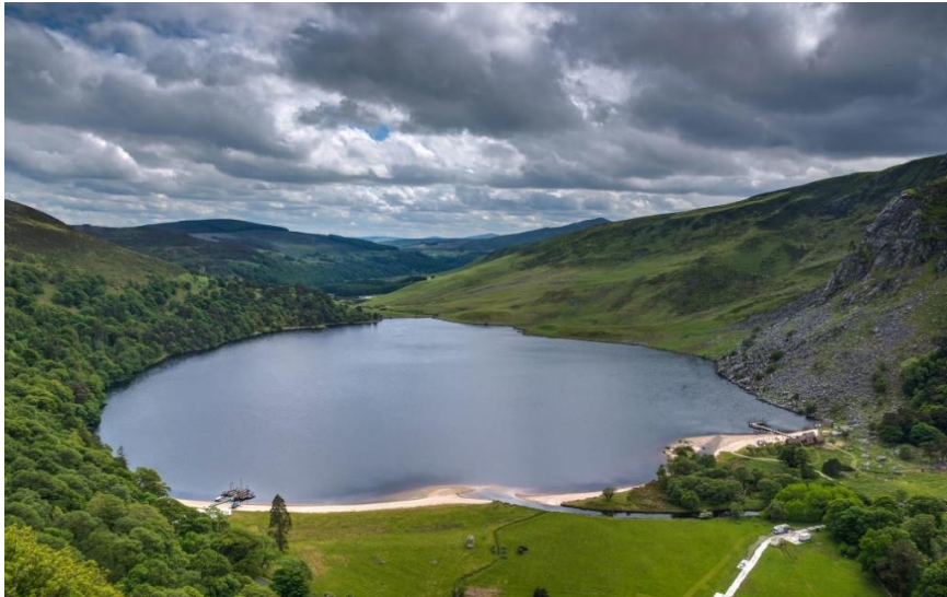
Figura 17. “Vikings” en Irlanda