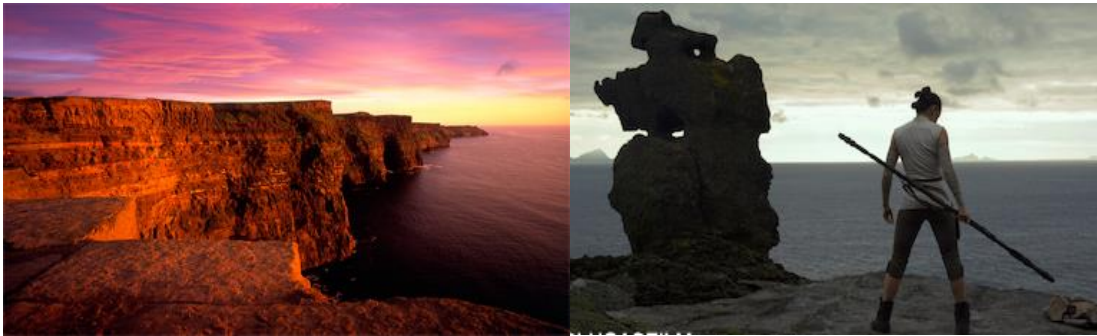
Figura 16. “Harry Potter” y “Star Wars” en Irlanda

De igual manera, hay una larga lista de importantes películas no galardonadas que tienen a Irlanda como escenario. Pueden encontrarse paisajes de Irlanda en grandes sagas como Star Wars y Harry Potter (Figura 16), así como en grandes títulos como “Drácula: La Leyenda Jamás Contada” o “Posdata: Te quiero”.