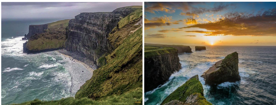
Figura 13. Acantilados de Moher y Kilkee