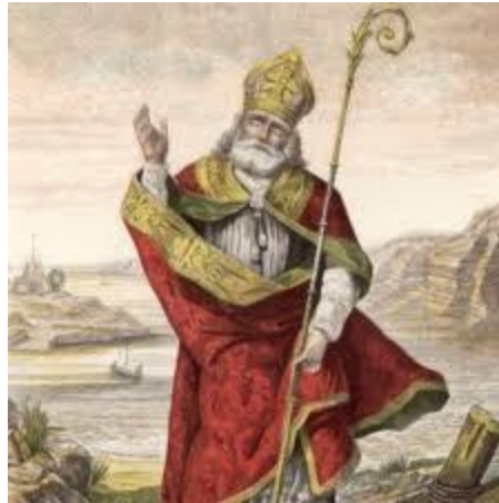
Figura 2. San Patricio, patrón de todos los irlandeses