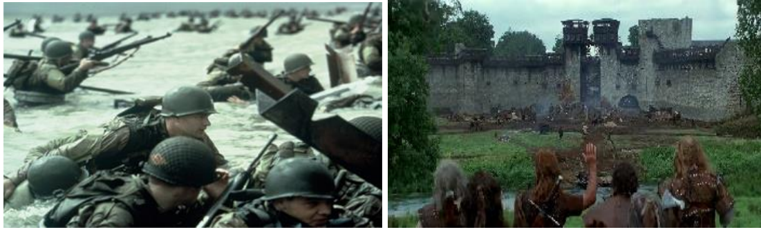
Figura 15. Los Oscar en Irlanda “Salvar al Soldado Ryan” y “Braveheart”