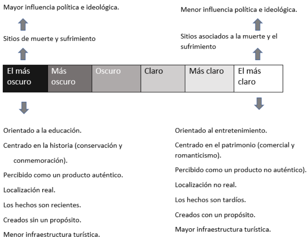
Figura 2.2. Niveles de oscuridad según los destinos turísticos.

Este autor propone un "espectro de oferta" que abarca desde las formas "más oscuras" hasta las "más claras" de turismo oscuro. Destaca siete amplias categorías caracterizadas por varios factores (espaciales, temporales, políticos e ideológicos) capaces de determinar una intensidad de "oscuridad" dentro de cualquier producto de turismo oscuro dado.