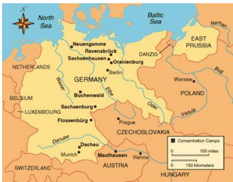
Imagen 3.1. Campos de concentración del territorio alemán.