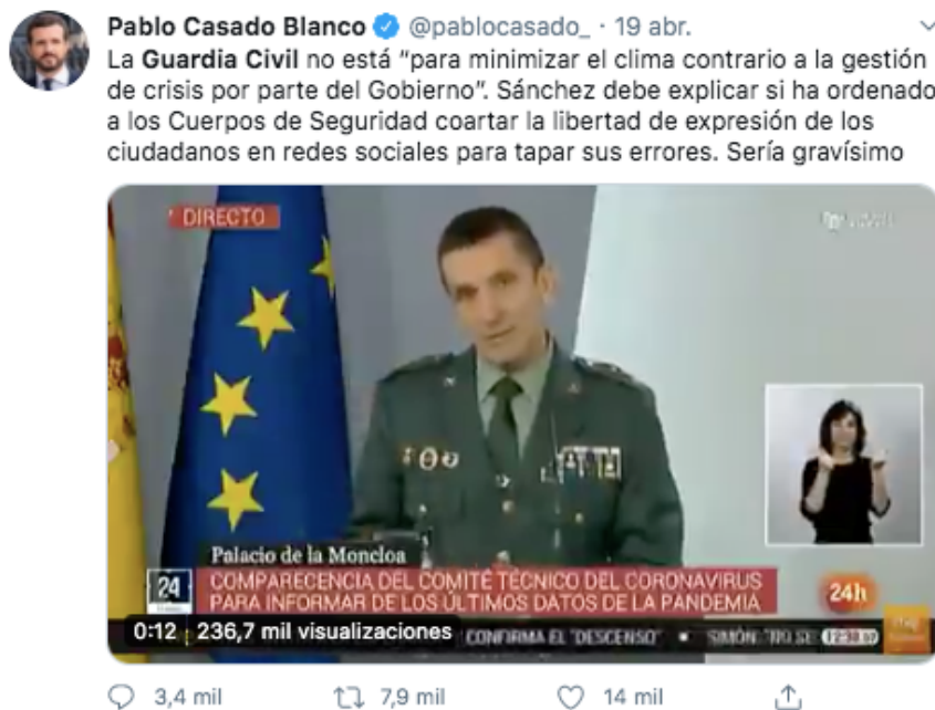
Imagen 12. Captura de un tweet de Pablo Casado