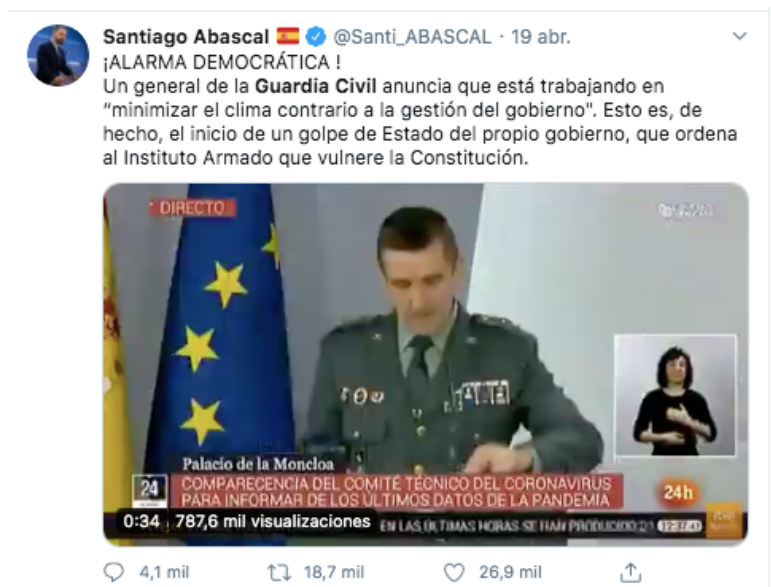
Imagen 11. Captura de un tweet de Santiago Abascal

ya que consideraba que de ser cierto, se trataba de una vulneración de la Constitución (19 de abril). Un día más tarde, anunciaba que presentaría una denuncia para que se investigara si lo dicho por el general Santiago era cierto así como para condenar a los posibles responsables. El líder de VOX publicó 4 tweets en los que trataba ese tema en dos días. Además, acusó al Gobierno de intentar llevar a cabo un “golpe de Estado”, basándose en el uso que se hizo durante el Estado de Alarma de los militares, policías y guardias civiles.