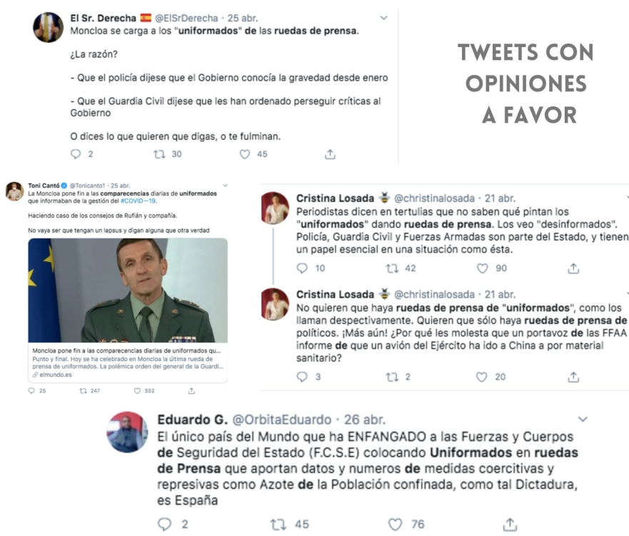
Imagen 10. Conjunto de publicaciones con opiniones a favor

Además, se preguntan sobre la necesidad de estas figuras en las comparecencias diarias en lugar de poner al frente a médicos o científicos. Otros también consideran que era un “postureo” la presencia de los uniformados y que tenía como objetivo “militarizar las ruedas de prensa”.