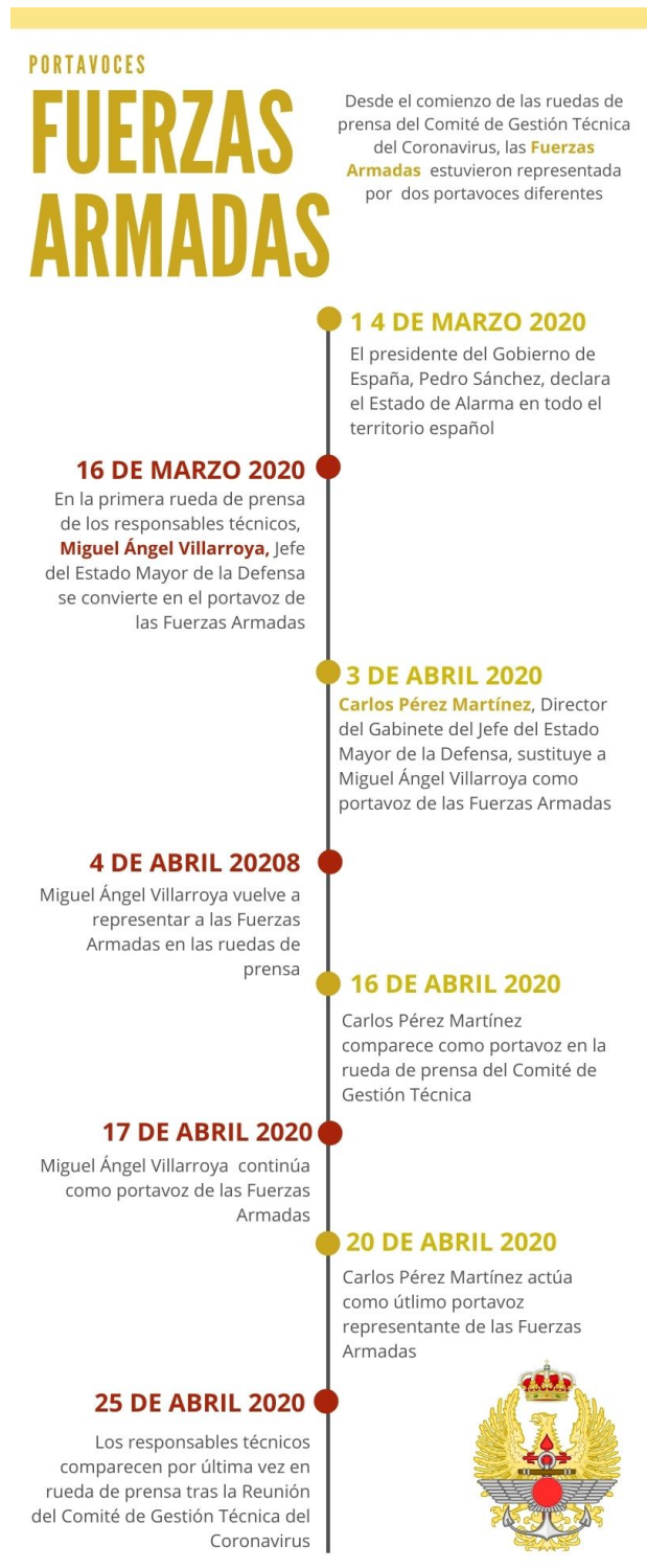
Gráfico 3. Portavoces Fuerzas Armadas

Villarroya, jefe del Estado Mayor de la Defensa, empleó un lenguaje bélico en muchas de sus comparencias, aunque sobre todo en las primeras semanas. Entre las palabras bélicas más usadas están: “Guerra”, “Batalla”, “Lucha” y “Soldados”.