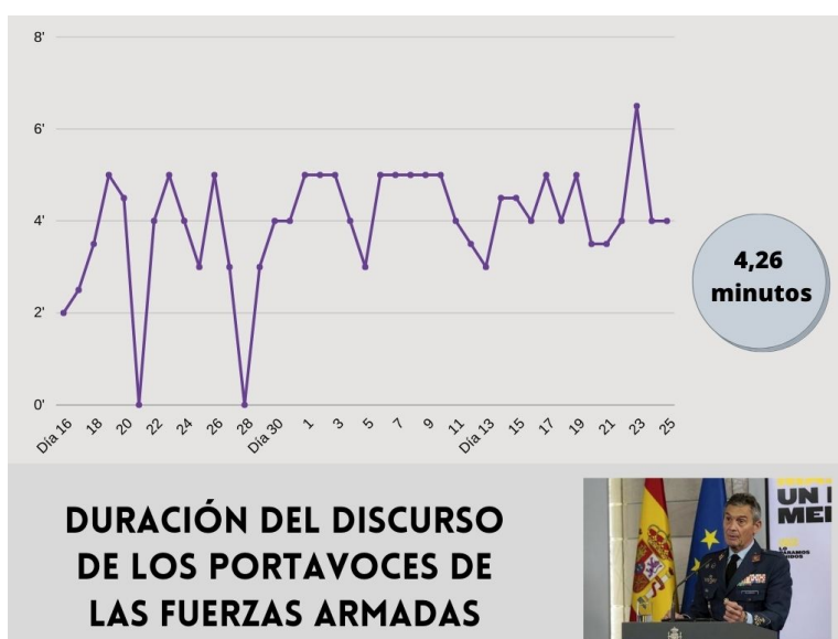
Gráfico 2. Duración del discurso