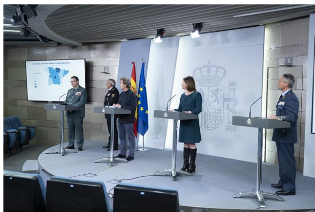
Imagen 2. Segunda rueda de prensa de los responsables técnicos