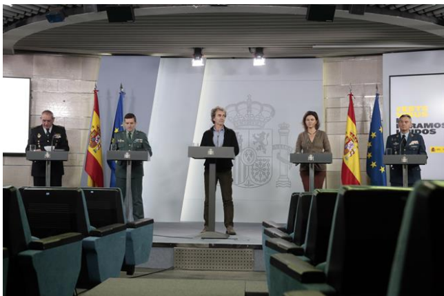
Imagen 3. Rueda de prensa de los responsables técnicos. 27 de marzo