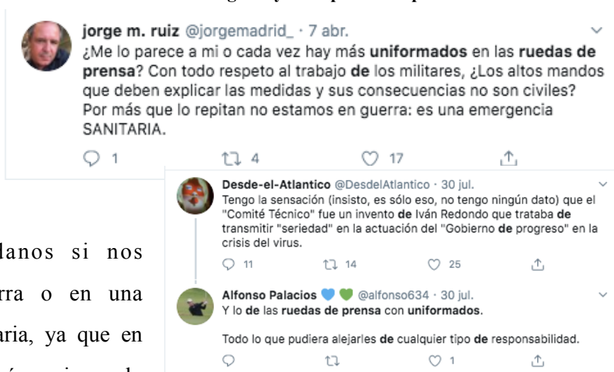
Imagen 4 y 5. Capturas de publicaciones en Twitter

gestión que se estaba haciendo de la pandemia desde las diferentes Fuerzas y Cuerpos de Seguridad del Estado. Una estrategia comunicativa que hizo preguntarse a los ciudadanos si nos encontrábamos en una guerra o en una situación de emergencia sanitaria, ya que en esta última situación debería primar la presencia de médicos o científicos en lugar de uniformados.