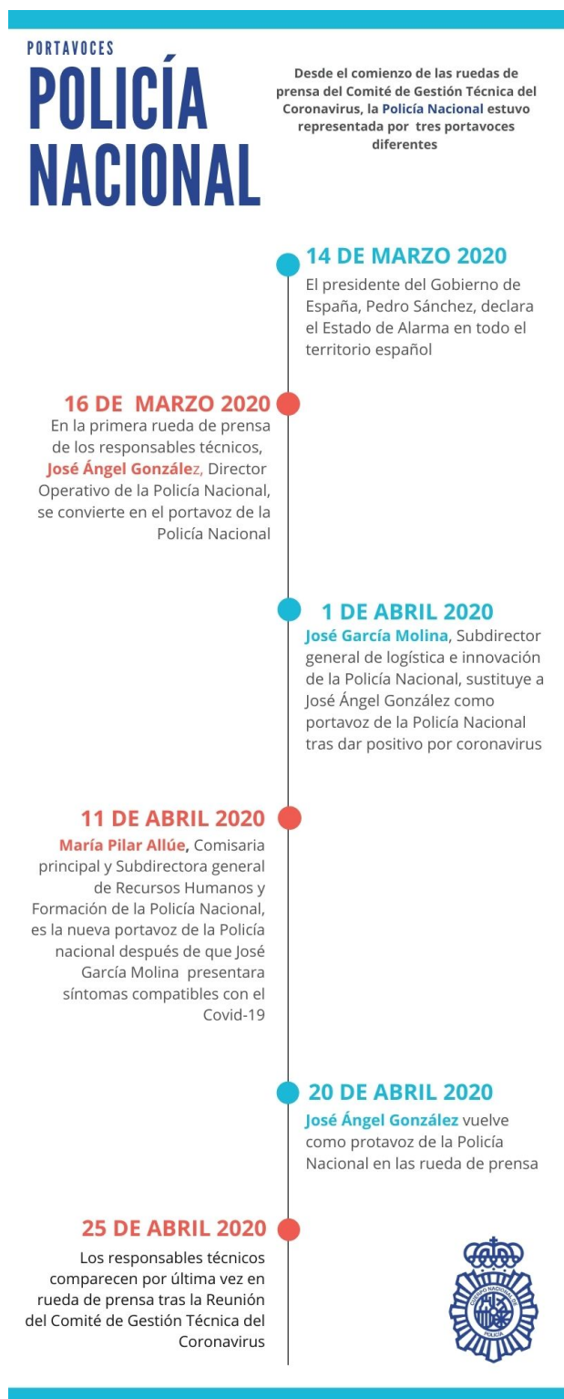
Gráfica 7. Portavoces de la Policía Nacional

anécdotas de los comportamientos irresponsables, las actuaciones en las fronteras terrestres, así como la violencia de género, la ciberdelincuencia y las fake news, donde hacía especial hincapié.