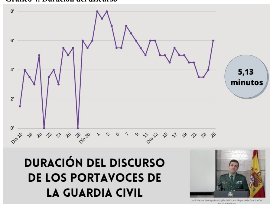
Gráfico 4. Duración del discurso