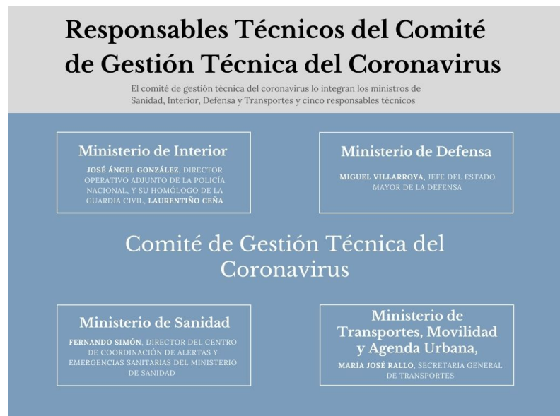
Gráfico 1. Desglose de responsables técnicos