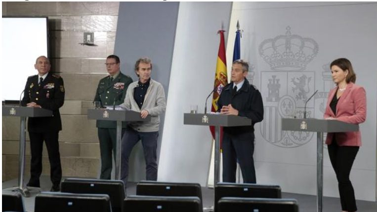
Imagen 1. Primera rueda de prensa del Comité de Gestión Técnica

Este comité se reunía cada mañana en el Palacio de la Moncloa para tratar la evolución de la