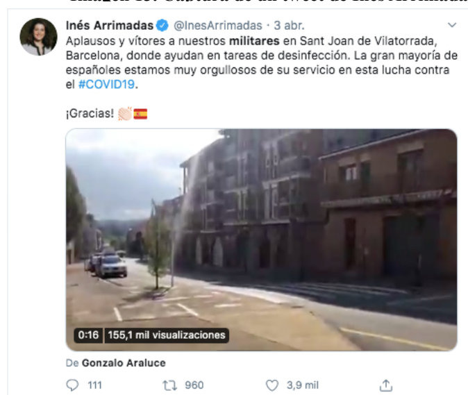
Imagen 13. Captura de un tweet de Inés Arrimadas

Para terminar, ninguno de los líderes de los partidos políticos que conforman el Gobierno de coalición, Pedro Sánchez y Pablo Iglesias, hicieron referencia alguna a los uniformados ni a las ruedas de prensa en el periodo analizado.