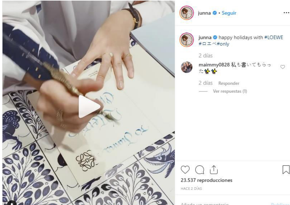
Imagen 1. Objetivo del post : potenciar la identidad de marca en Loewe

Como muestran los porcentajes de resultados (Tabla 3), los posts publicados se concentran en la promoción de la marca y del producto por delante del influencer . Destacan los mensajes dirigidos a reforzar la imagen de marca en Gucci (58.8%) y en Loewe (56,3%), mientras que en Margiela es el producto, el ítem, que concentra la máxima atención del post (80%).