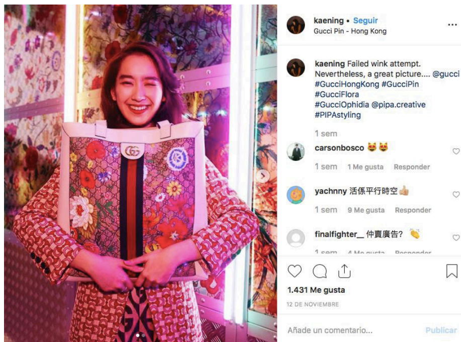
Imagen 3. Objetivo del post : potenciar la identidad de marca en Gucci