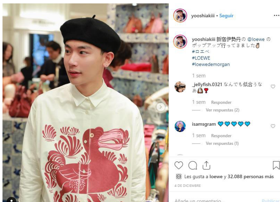
Imagen 4. Objetivo del post : promoción del influencer en Loewe

Como contraste, los valores de promoción de la figura del influencer , aunque ocupan un tercer lugar por delante de otros registros (director creativo y celebrities ), son inferiores y reflejan un menor protagonismo. De las tres marcas analizadas, Loewe es la que mayor número de posts con referencia a influencers muestra (17,5%) frente a los porcentajes de Gucci (12,5%) y de Margiela (8,8%).