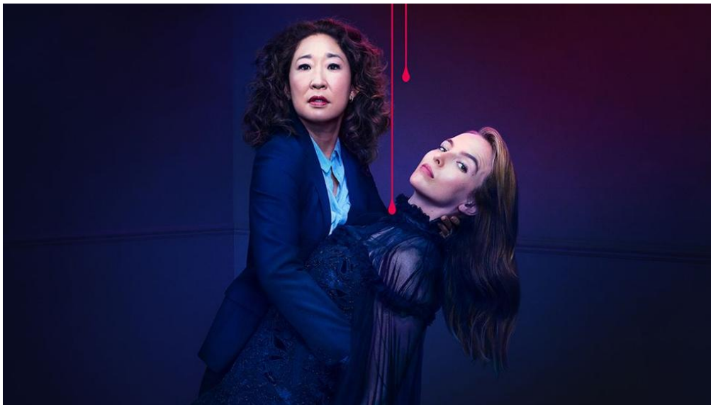
IMAGEN 9. FOTO PROMOCIONAL DE KILLING EVE . FUENTE: BBC América

escapar de los demonios internos que Villanelle le ha despertado, pero verdaderamente no tienen tantas diferencias. Otro momento clave del capítulo y de la serie es lo que Villanelle le dice a Eve cuando esta le trata con frialdad y distancia, lo que hace que Villanelle se acabe hartando: “no lo olvides, lo único que te hace interesante soy yo” . Esta frase refleja muchas cosas en la serie: Si nos fijamos, el recorrido del personaje de Eve comienza cuando esta empieza a investigar los asesinatos de Villanelle y se acentúa cuando la conoce y cae en una completa obsesión por ella. Eve hace cosas que jamás en su vida normal habría pensado que sería capaz de hacer, como apuñalar a alguien, torturar o anteponer su matrimonio a una psicópata asesina de la que se ha enamorado. Para Eve, Villanelle puede ser su personalidad más profunda y reprimida, la personalidad que tenía en la sombra y que no era capaz de reconocer.