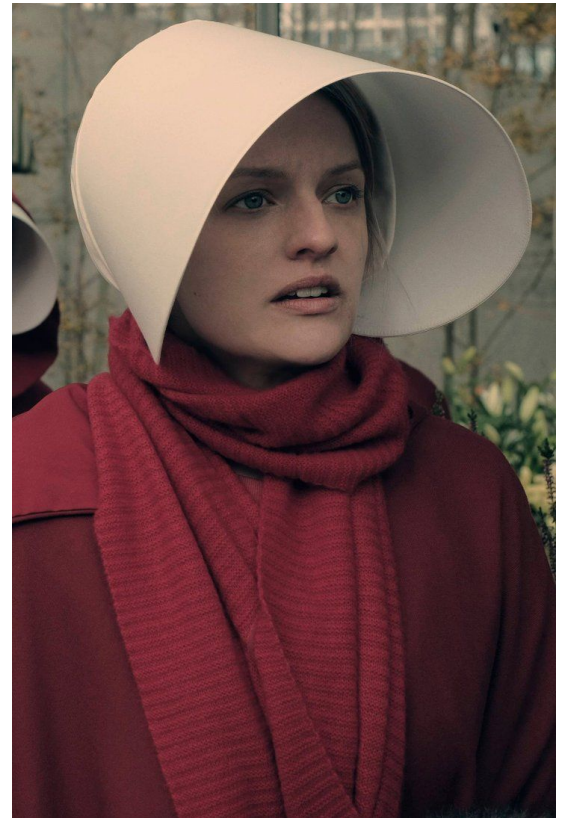
IMAGEN 1. FOTOGRAMA DE EL CUENTO DE LA CRIADA.

Usando las herramientas dadas por Greimas como el esquema actancial, analizaré a los personajes de Killing Eve moviéndome en el marco del esquema y viendo cuál es el resultado de las diferentes acciones de los personajes.