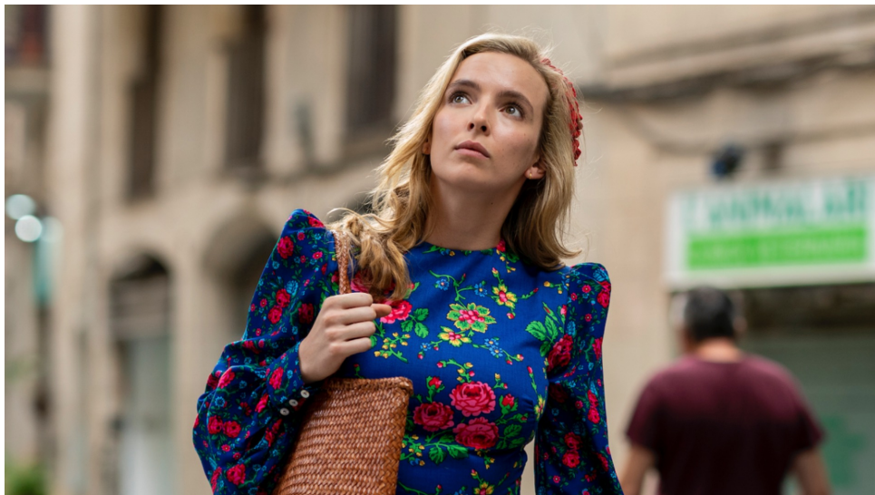
IMAGEN 7. FOTOGRAMA DE KILLING EVE . FUENTE: https://www.gamesradar.com/killing-eve-season-3-jodie-comer-villanelle/

Solo trato de encontrar formas de hacerme sentir algo. Más y más y más, pero... no hace ninguna diferencia. No importa lo que haga, no siento nada. Me lastimé, no duele. Compró lo que quiero, no lo quiero. Hago lo que me gusta... no me gusta. Estoy tan aburrida - Killing Eve : Temporada 2, Episodio 6 (2019)