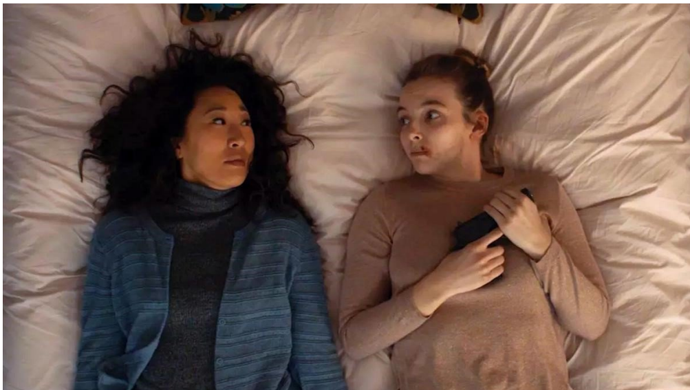
IMAGEN 8. FOTOGRAMA DE KILLING EVE . FUENTE: BBC América

En el último capítulo de la primera temporada Eve encuentra dónde vive Villanelle. Allí Eve desata su furia rompiendo cosas de la casa y le echa en cara haber perdido su vida por su culpa. Eve llega a amenazar con una pistola a Villanelle diciendo que la va a matar pero Villanelle está segura de que no lo hará porque a Eve “Le gusta demasiado”. Eve le confiesa que piensa en ella constantemente, tiene una obsesión plena por ella y no le deja hacer otra cosa que no sea pensar en ella, quiere saberlo todo acerca de ella, a lo que Villanelle le confiesa que ella también. Aquí vemos cómo ambas saben que están obsesionadas la una de la otra. Vemos como Villanelle quiere vivir con ella, que estén juntas y “tener a alguien con quien ver películas los domingos” lo que nos muestra algo de debilidad y de sentimientos por su parte. Tras esto comparten una escena íntima entre las dos en la cama, tumbadas una al lado de la otra, relajadas, con una tensión sexual notable y sin temerse, como iguales. Es en ese momento cuando, por sorpresa, Eve saca una navaja y apuñala a Villanelle