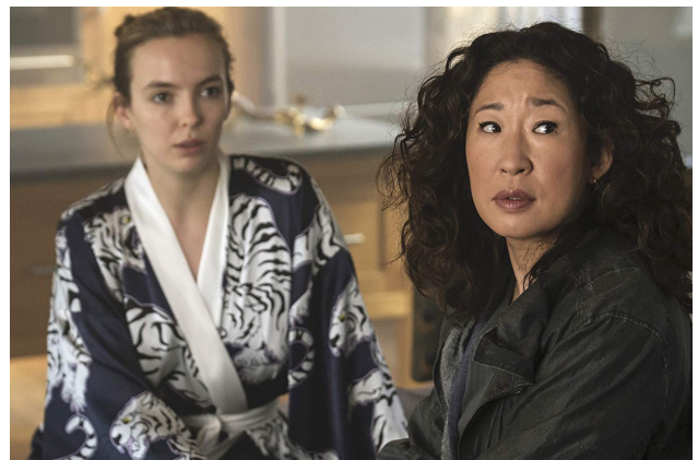
IMAGEN 4. FOTOGRAMA DE KILLING EVE . FUENTE: https://fuera series.com/killing-eve-critica-temporada-2-final-4d6dd268be23?gi=df77e6a0f928

El motor principal de la trama al comienzo de la serie eran esos asesinatos cometidos en distintas ciudades, sin relación ni explicación aparentes. Conforme avanza la trama vemos cómo dejando en un segundo plano los asesinatos, los sentimientos de Eve y Villanelle toman protagonismo. Se pasa de una persecución para detener a la asesina, a una rotura de la rutina de Eve que colma con el choque con Villanelle, transformando su deseo de atraparla en una obsesión y atracción fatal que no hace más que desviar de su objetivo primario a cada una de las dos protagonistas.