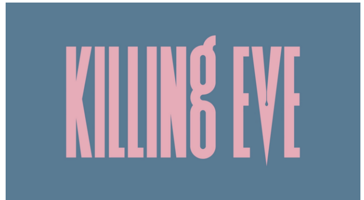
IMAGEN 6. LOGO DE KILLING EVE .

Vemos que Eve llega a matar por Villanelle al final de la segunda temporada y vemos cómo llega a justificar muchos de sus actos poniendo a