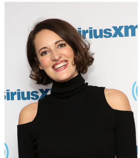
IMAGEN 3. PHOEBE MARY WALLER-BRIDGE.

BBC America anunció el 15 de noviembre de 2016 que había dado luz verde a la producción de ocho capítulos de una serie llamada Killing Eve con Phoebe Mary Waller-Bridge al frente como creadora, showrunner y productora ejecutiva. Esta serie estaría basada en la novela de Like Jennings “Codename Villanelle”. La serie se estrenó un 12 de enero de 2018 con una popularidad inmediata y un éxito visible. Antes de su estreno, la cadena ya la renovó por una segunda temporada, confiando así en una buena acogida.