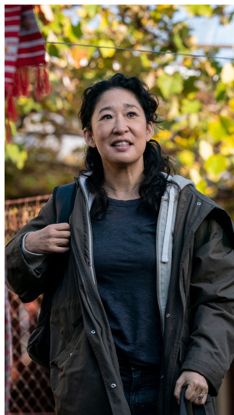
IMAGEN 5. FOTOGRAMA DE KILLING EVE .