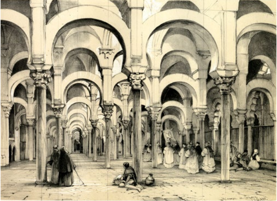
Imagen 4. Lewis (dib). Interior de la mezquita-catedral (1835).

ciudades. 27 Dedicó dos exquisitas litografías al interior de la mezquita-catedral, una de ellas muy similar al citado dibujo de Harriet Ford (litografiada en 1835).