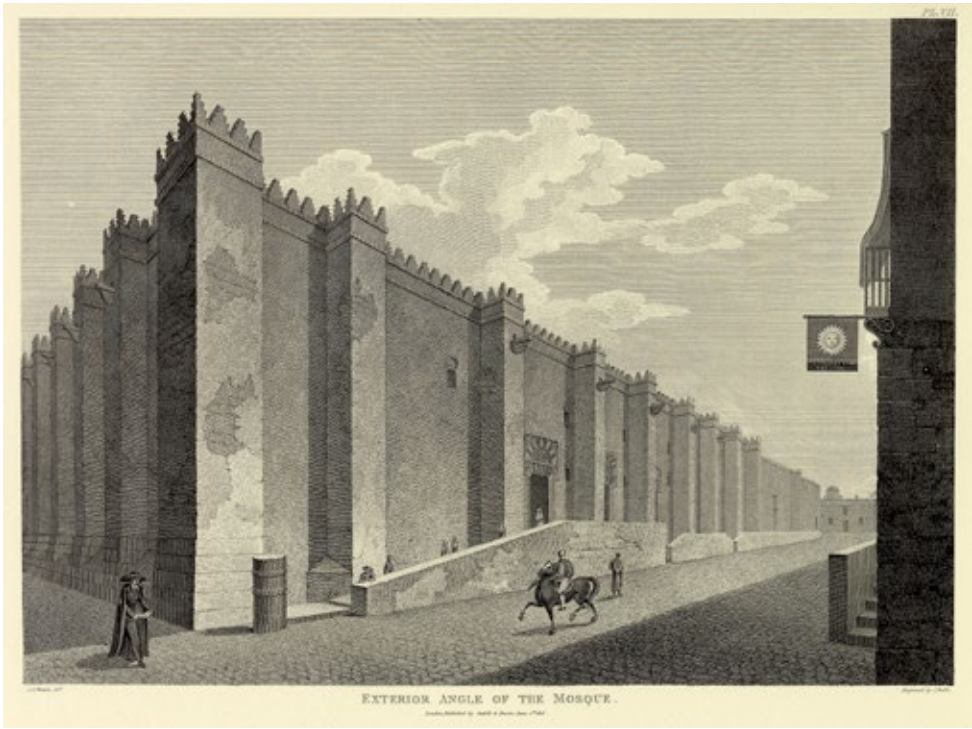
Imagen 2. Murphy (dib.) y Roffe (grab.). Exterior de la mezquita (1813).