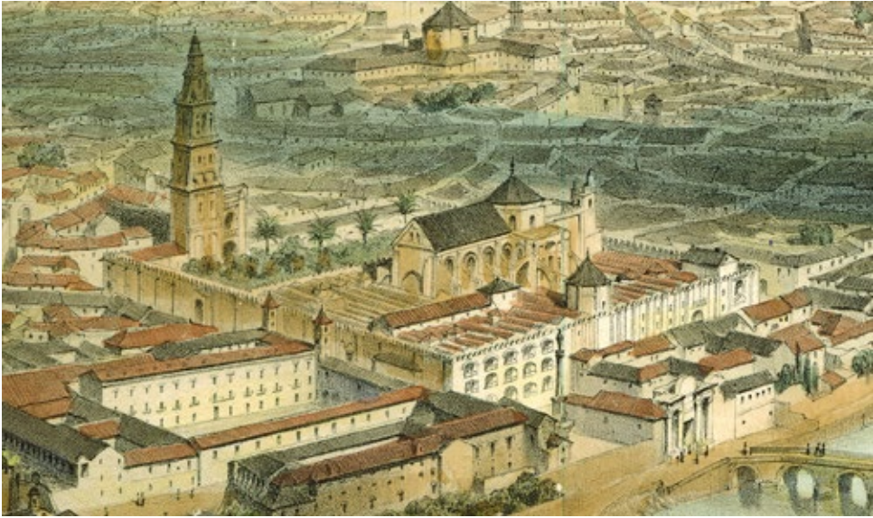
Imagen 8. Guesdon (1853). Detalle de la mezquita-catedral en la vista aérea de Córdoba.