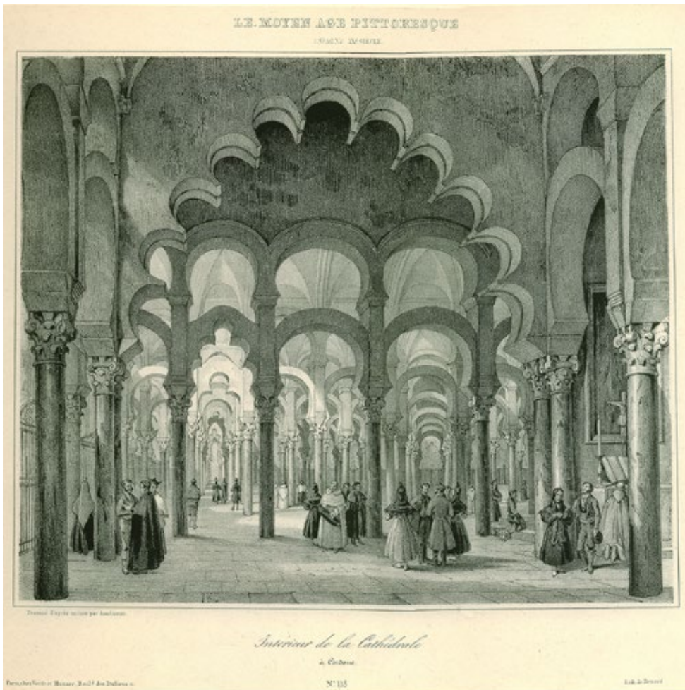
Imagen 7. Asselineau (dib.) y Benart (lit.). Interior de la catedral (c. 1840).